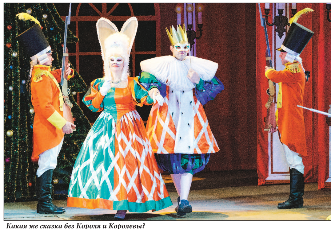
Какая же сказка без Короля и Королевы?

Интервью с артистами читайте в ближайшем номере газеты.