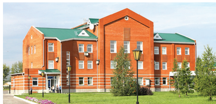
АБК Сибайского ЛПУМГ