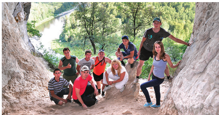
Участники путешествия у входа в грот

В последние дни августа молодые специалисты совершили сплав по реке Белая. Сегодня ребята делятся впечатлениями о путешествии.