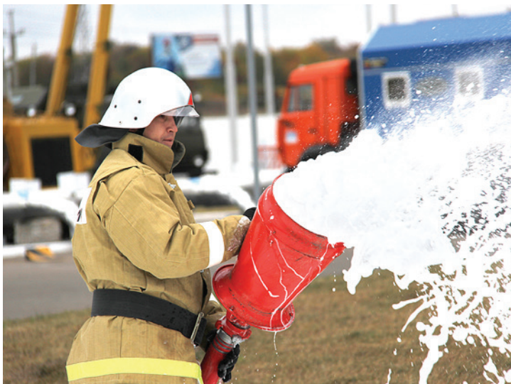
Результат учений: пожар на АЗС потушен за 15 минут

В рамках обучения также прошли учебно-методические занятия, контрольное тестирование по воинскому учету и бронированию граждан, работающих в Обществе. Участники сбора выступили с докладами, в которых затронули вопросы оказания первой помощи, организации и проведения тренировок по гражданской обороне и защите населения в чрезвычайных ситуациях, а также порядок организации работ по локализации и ликвидации аварии на примере той, что произошла в начале апреля этого года на одном из производственных объектов Ургалинского ЛПУМГ. – Каждый год мы посещаем разные филиалы, чтобы показать работу служб Общества по граж-