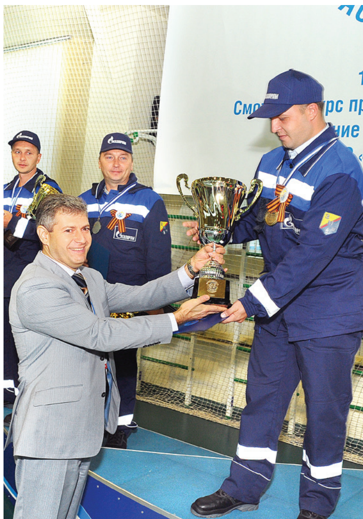
Вручение кубка победителю конкурса