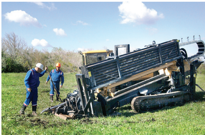
Прокладка кабельной линии связи методом ГНБ

В этом году в соответствии с планом капитального ремонта управлением связи выполнен ремонт кабельных линий связи, проходящих через автодороги, участков при пересечении оврагов, подводных переходов общей протяженностью 785 метров с применением горизонтально-направленного бурения (ГНБ). Ликвидированы последствия разлива рек, приведшего к разрыву кабеля. Также ремонтные работы проведены на оборудовании двух цифровых систем передачи. Сдача объ-