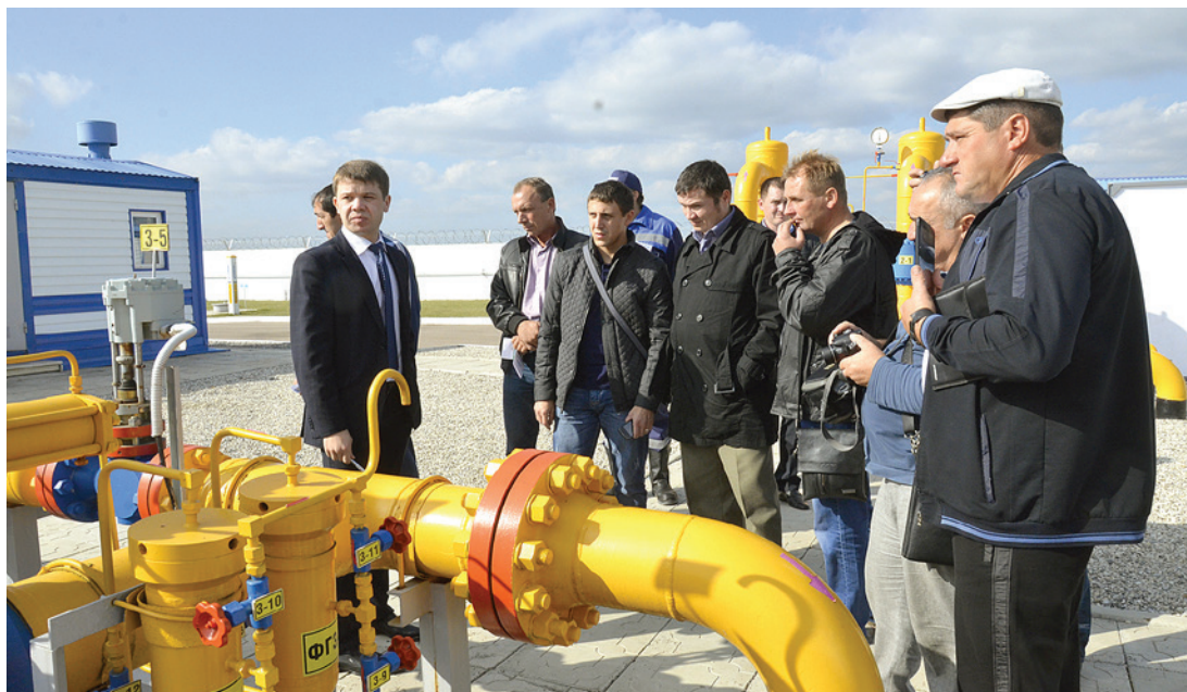
Участники конкурса посетили ГРС «Шакша»

Татьяна КРУГЛОВА, Эмиль ШАЯХМЕТОВ.