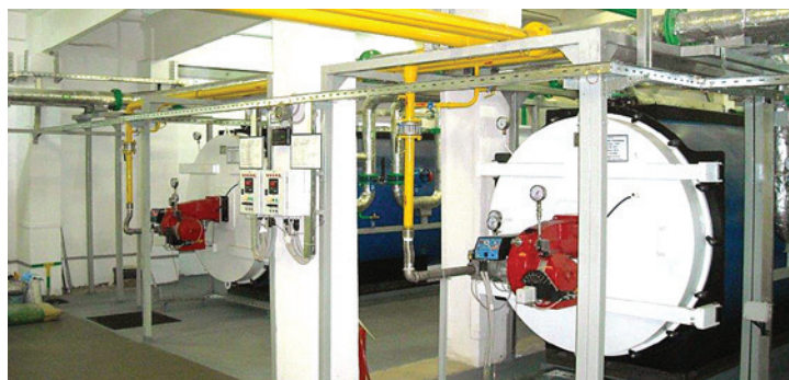
Обновленная котельная Стерлитамакского ЛПУМГ