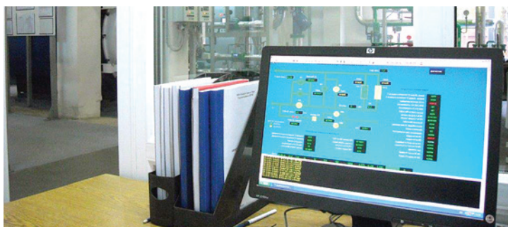
Система телемеханики позволяет оператору проводить оперативный мониторинг техпроцесса