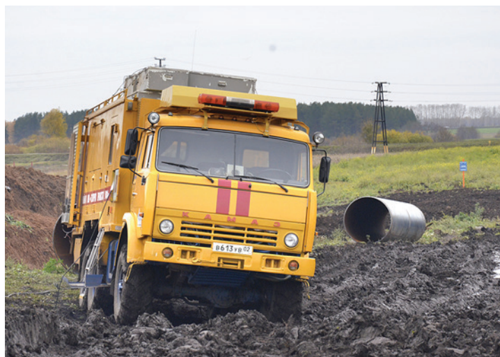
АВП Кармаскалинского ЛПУМГ Общества

В ООО «Газпром трансгаз Уфа» имеются три АВП: Кармаскалинский, Шаранский, Полянский. Эти подразделения являются небольшими по численности, закреплены за филиалами Общества и находятся в оперативном подчинении у производственного отдела по эксплуатации магистральных газопроводов (ПОЭМГ). В зоне ответственности