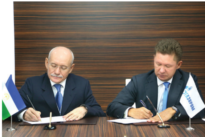
Президент Башкортостана Р. Хамитов и председатель Правления ОАО «Газпром» А. Миллер утверждают «Дорожную карту»

19 сентября на XIII Международном инвестиционном форуме в Сочи утверждена «Дорожная карта» к проекту расширения использования высокотехнологичной продукции организаций Республики Башкортостан.