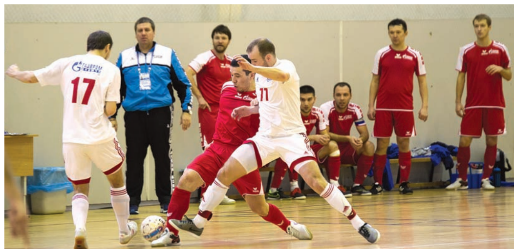
Идут последние минуты

Спартакиада закончилась, победители известны, а в спорткомплексе нефтяного университета еще шли бои неместного значения. Команды Сургута и Екатеринбурга играют матч престижа по мини-футболу. Сражаются взрослые. Мальчишки из юниорских команд пришли поддержать своих.