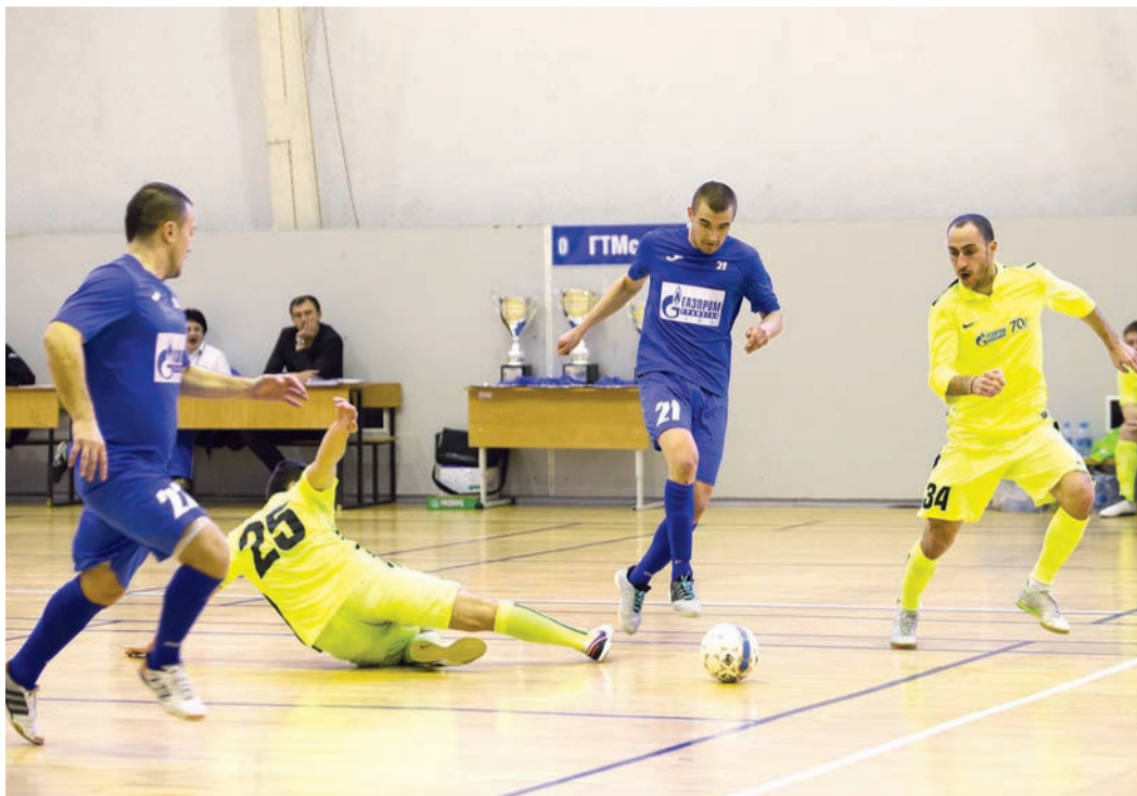
Не подпустить соперника к воротам

Заключительный игровой день мини-футбольного турнира в спорткомплексе УГНТУ получился очень интересным. Всего две игры, но какие разные!