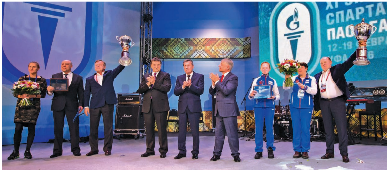
До встречи в октябре!