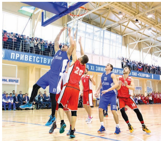
Только сегодня и только сейчас