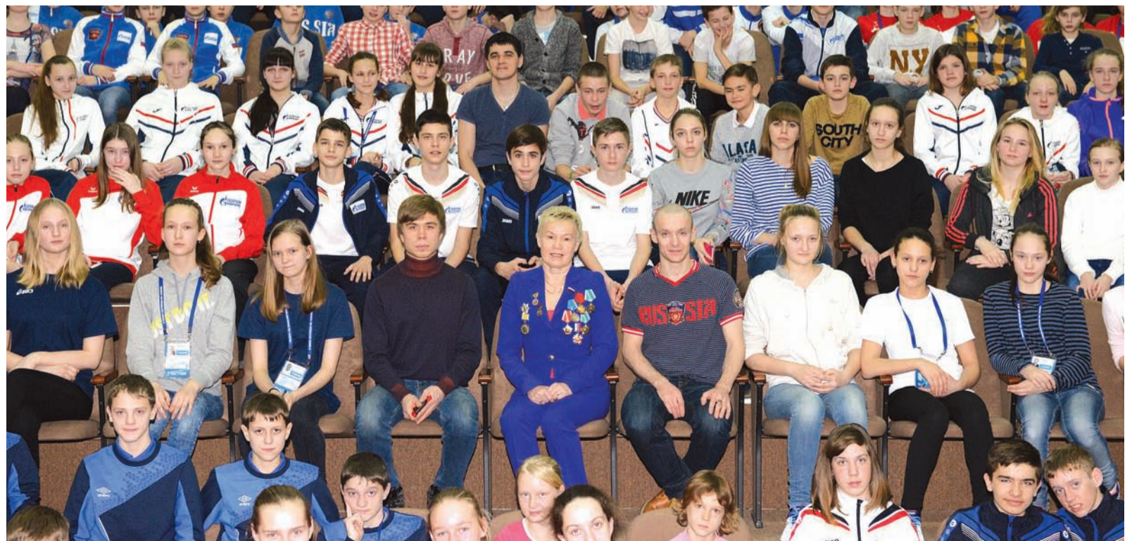
И напоследок – фото на память

– Проведение Спартакиады, в которой участвуют дети и молодежь, – большой рывок в будущее. Искренне благодарны «Газпрому», который взял на себя замечательную инициативу и дал возможность в Уфе стать участниками соревнований детям с ограниченными возможностями. Это очень важно и для остальных ребят. Для всех это пример мужества, жизнелюбия, стойкости.