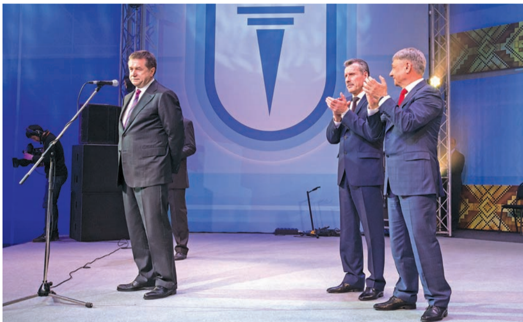
«Спартакиады воспитывают коллективы»

– Уфа остается центром притяжения России. Здесь прошли международные форумы ШОС и БРИКС, сейчас – Спартакиада. А в октябре мы будем проводить в Уфе фестиваль «Факел». Решение уже принято «Газпром». Нам снова доверяют большое массовое корпоративное газпромовское мероприятие. И я вам говорю не «прощайте», а «до скорой встречи!» – сказал он. – Я надеюсь, что нам удалось создать комфортную и добрую атмосферу, мы старались, чтобы