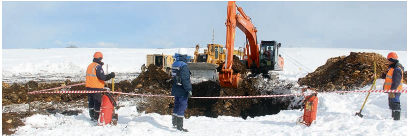
Земляным работам при подготовке трассы к ремонту уделяется пристальное внимание

В Шаранском и Аркауловском ЛПУМГ прошли работы по замене участков магистрального газопровода Челябинск–Петровск. Корреспонденты «ГАЗЕТЫ» побывали в местах ремонта, став свидетелями одних из первых огневых работ на трассе в этом году.