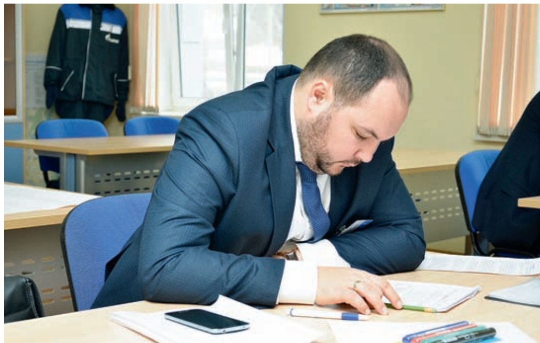
«Центр оценки» подготовил для участников различные упражнения