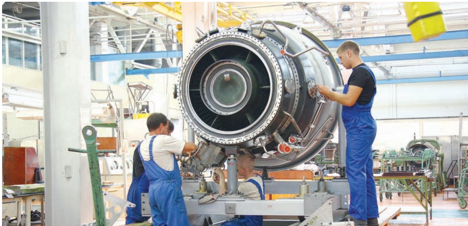
В сборочном цехе УМПО