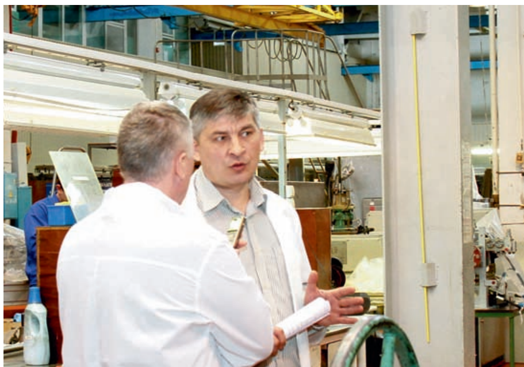
Сургутские коллеги на Уфимском моторостроительном заводе