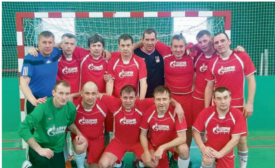
Команда, без которой мне не жить!

– Спорт для меня – это любимое хобби. Всю жизнь играю в футбол и волейбол. Это помогает мне отдыхать от трудовых будней, воспитывает характер. По-моему, человеку, в жизни которого есть место спорту, легче принимать решения, у него хорошо развито умение ставить цели и стремиться к победе в любом деле.