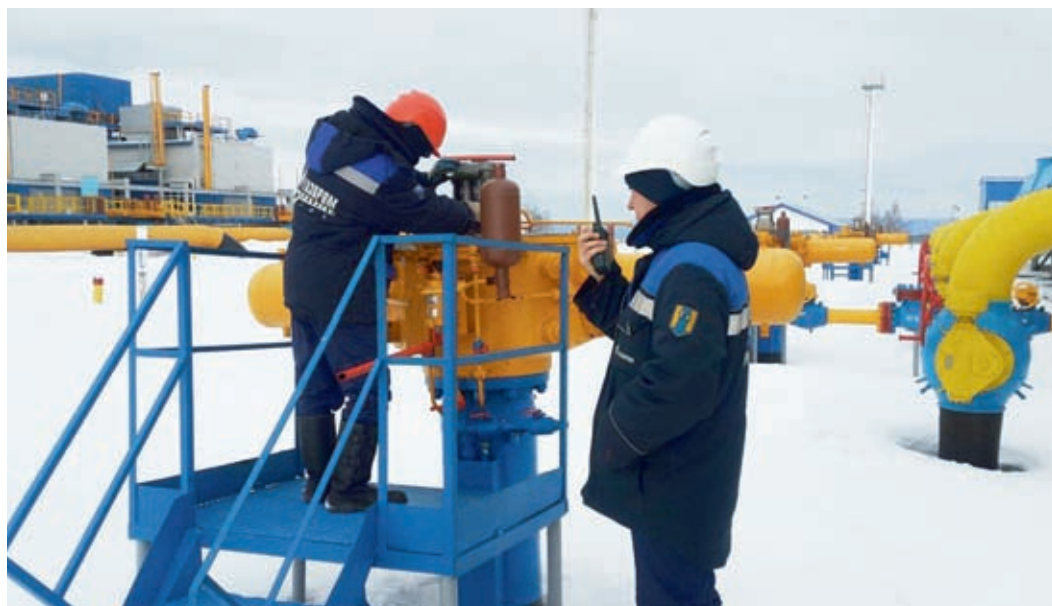
Общество планомерно готовится к весеннему паводку

Подготовила Ольга ЗУБАЧЕВСКАЯ.