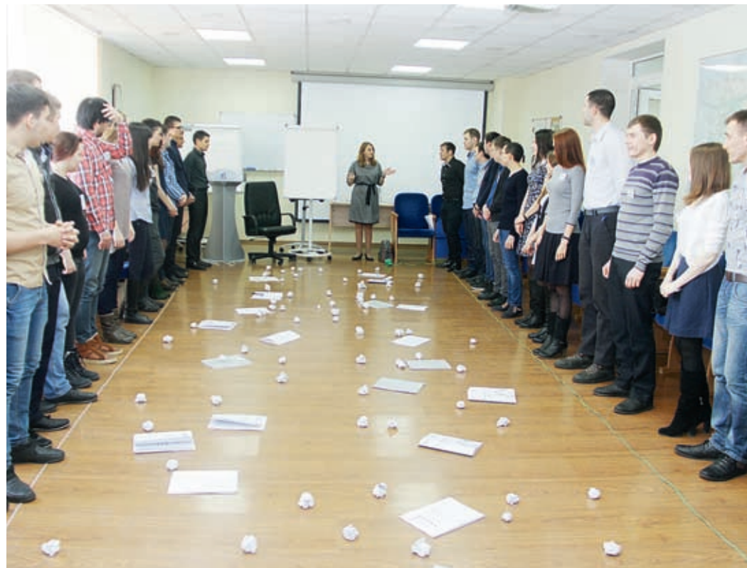
Молодые специалисты проходят тренинг целеполагания