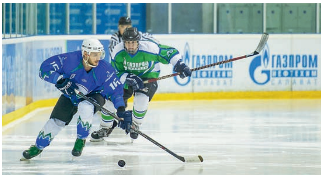
Матч с «Газпром нефтехим Салават»