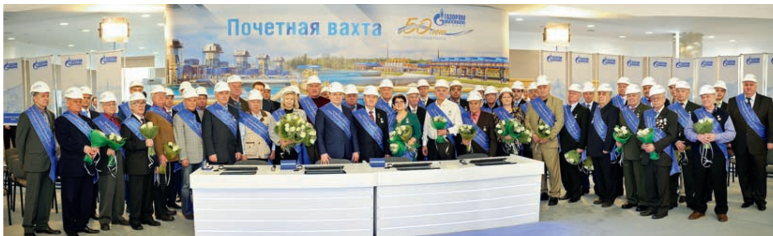
Почетную вахту в честь 50-летия ООО «Газпром трансгаз Югорск» несли лучшие работники и ветераны предприятия