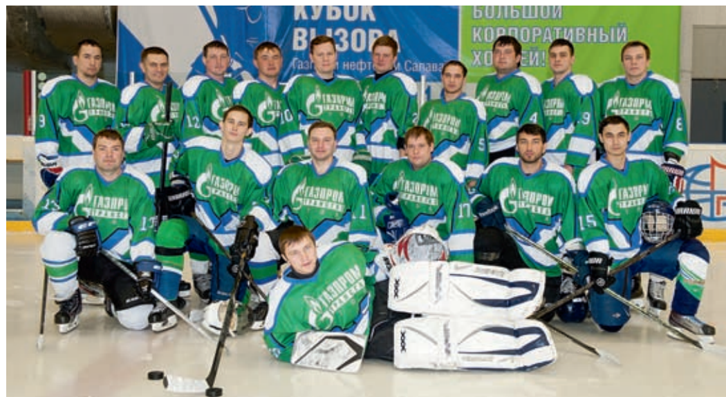
Сборная по хоккею ООО «Газпром трансгаз Уфа»