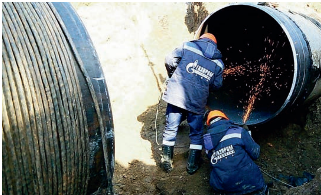
Огневые в Шаранском ЛПУМГ были самыми масштабными