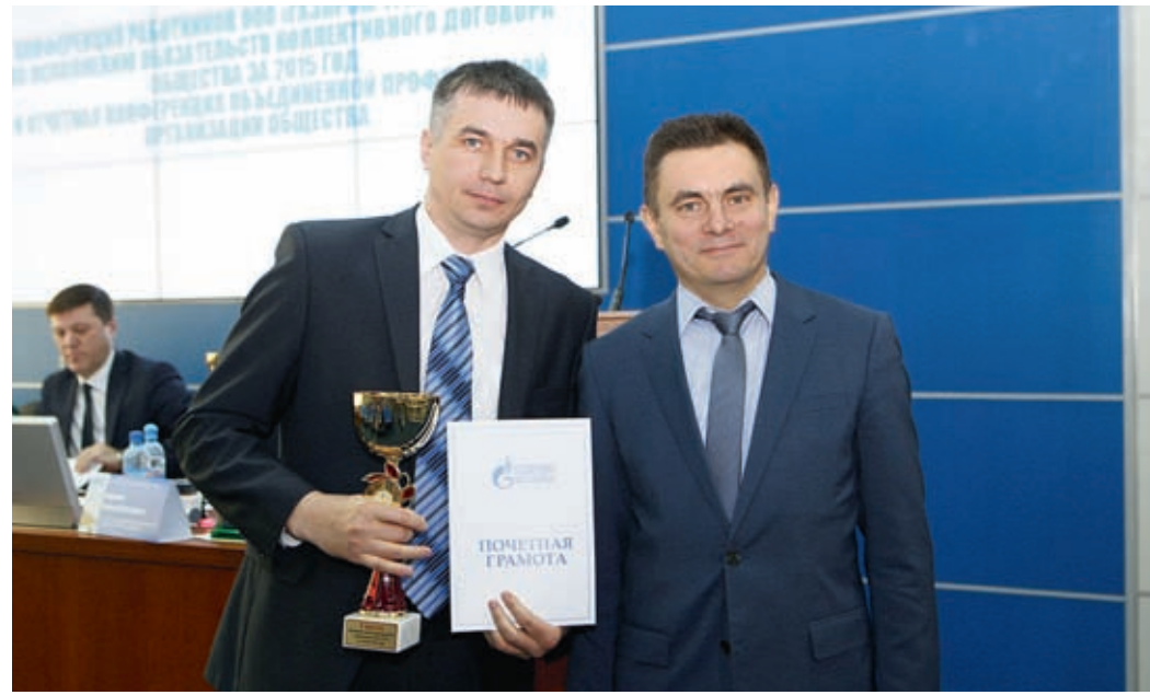
Победителем производственно-экономического соревнования за 2015 год в первой группе признано Поляское ЛПУМГ