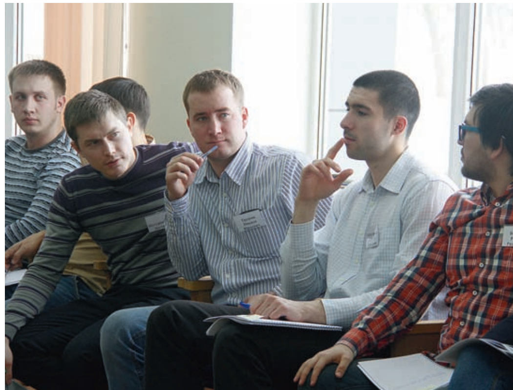
Момент, когда цель становится задачей