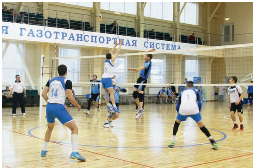
Готовы биться за победу