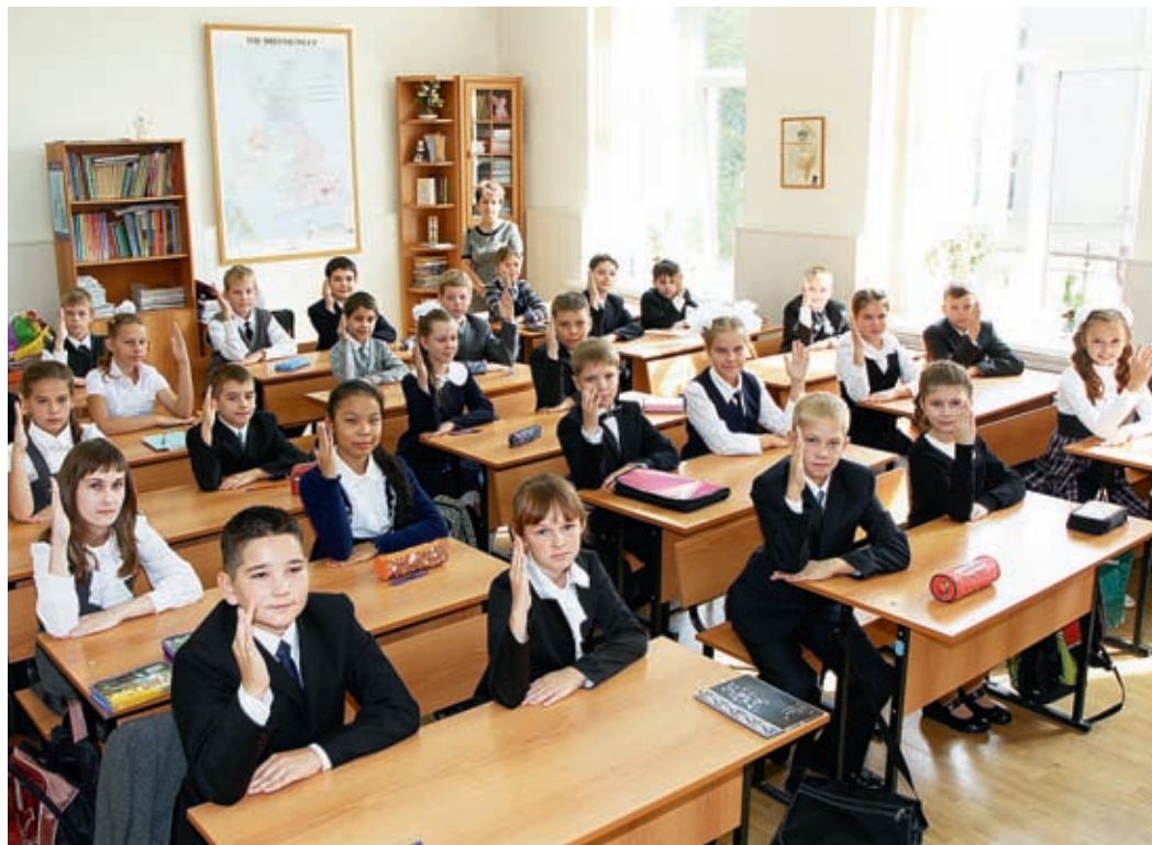
Кто хочет учиться в «Газпром-классе»?