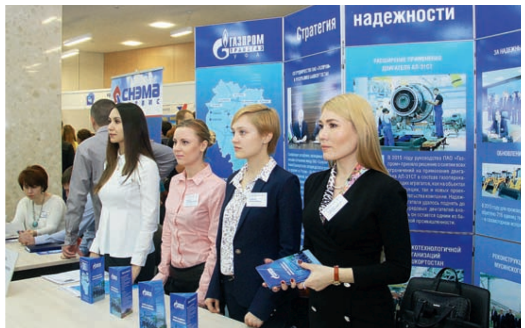
Специалисты группы развития и найма готовы ответить на все вопросы о трудоустройстве