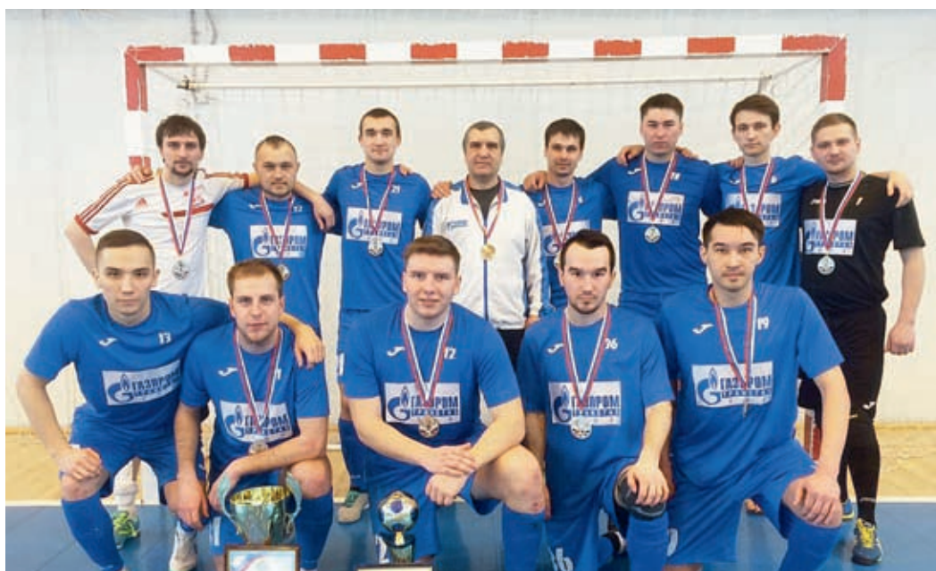
Команда по мини-футболу «Витязь – Газпром трансгаз Уфа»