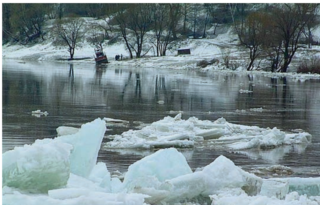
Зимняя водность рек республики в этом году выше средних многолетних значений

К тому же эта зима была теплой, периоды морозной погоды – непродолжительными. Среднемесячная температура в декабре была на пять-шесть градусов теплее обычно-