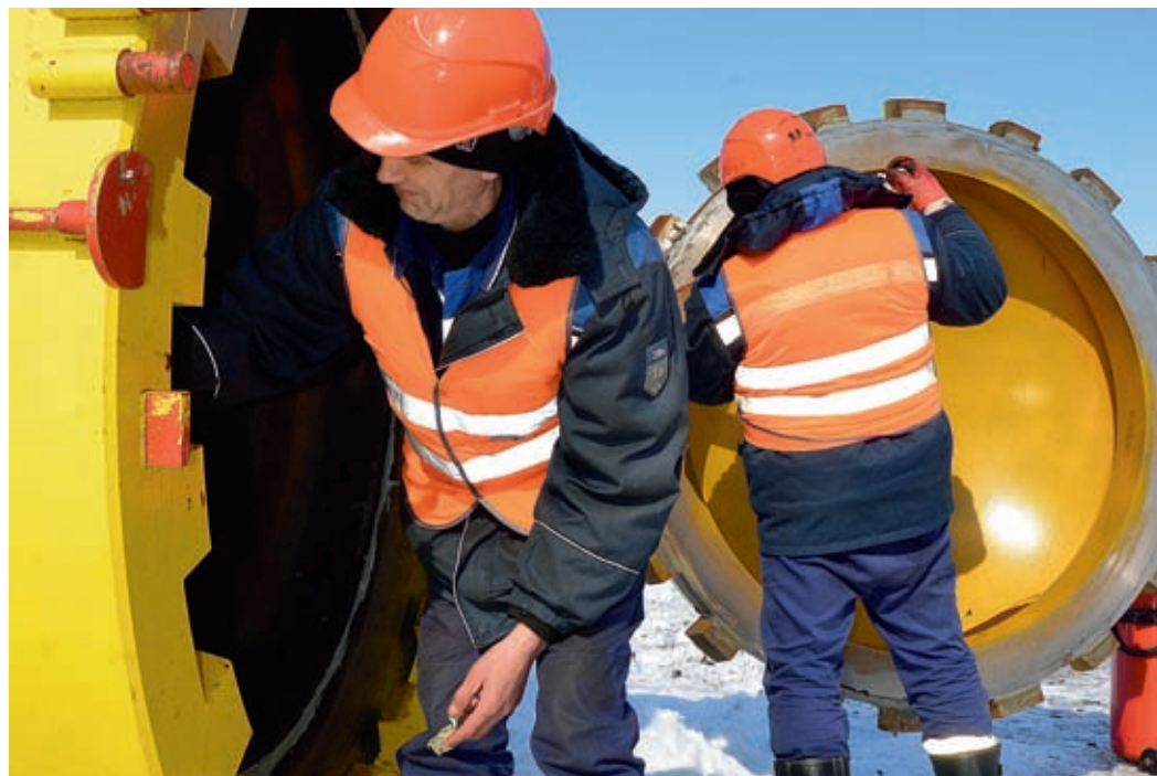
Рабочие готовят камеру запуска очистных устройств к работе