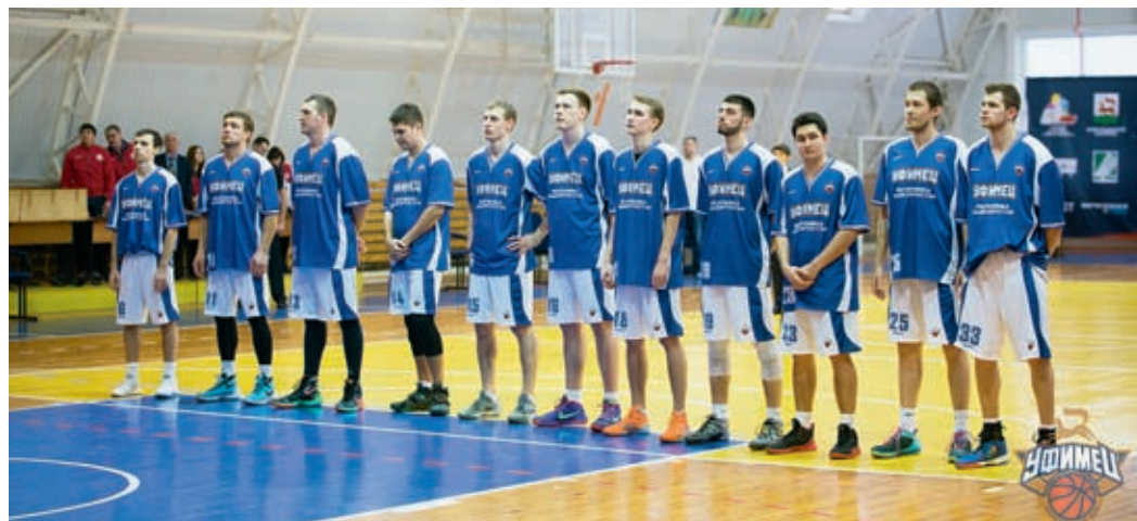
Команда «Уфимец» к игре готова!

игры плей-офф, где сразится с лучшими командами турнира.