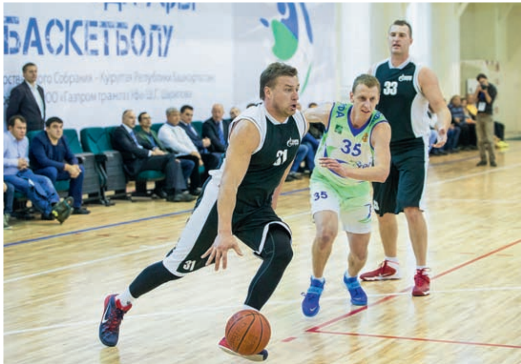
«Витязи» в третий раз стали лучшими в Уфе

Баскетбольная команда «Витязь» ООО «Газпром трансгаз Уфа» одержала победу в регулярном чемпионате Уфимской баскетбольной лиги сезона 2015–2016 годов. Впервые газотранспортники стали чемпионами города еще в сезоне 2013–2014 годов, лишив тогда звания действующего чемпиона команду «Уралтранснефтепродукт». С тех пор на протяжении двух лет «Витязь» успешно защищает свой титул. В этом календарном году основными конкурентами команды в чемпионате стали «Уфабаскет» и БГАУ.