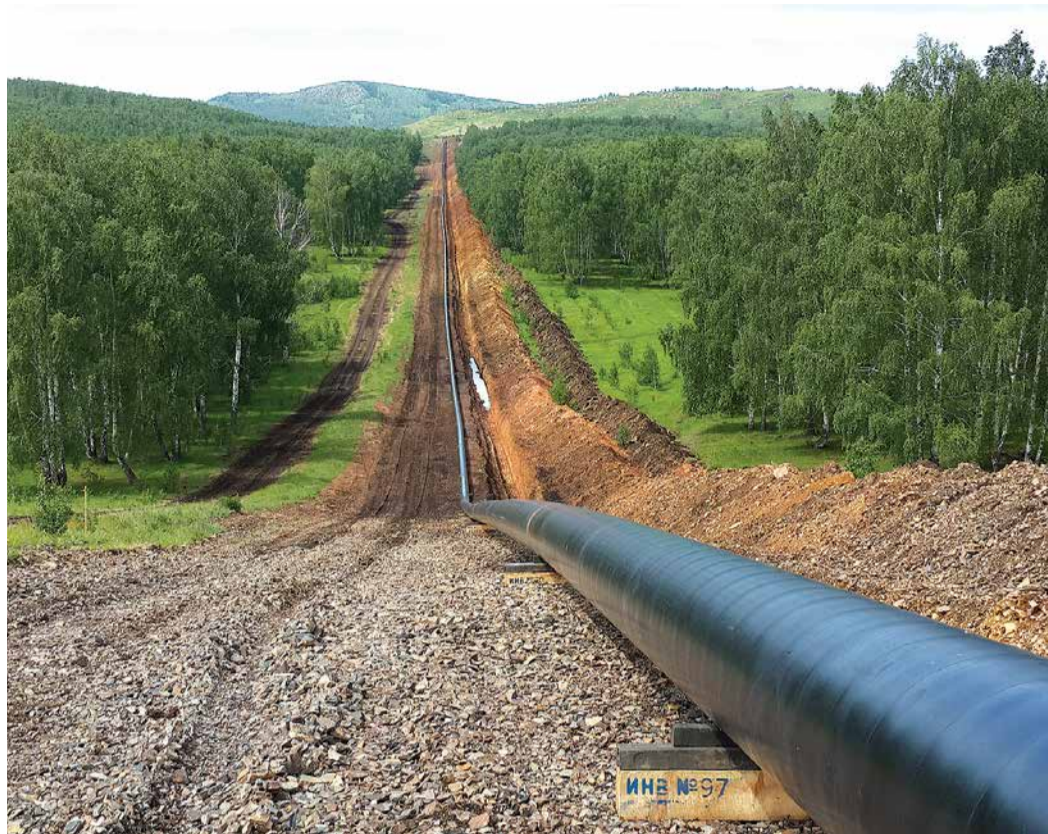
Газопровод Магнитогорск-Ишимбай проложен через горные хребты

Главный инженер филиала пояснил, что проектом предусмотрена полная замена труб на участке 178–186 км газопровода Магнитогорск-Ишимбай. Вся технология подразумевает применение термоусаживающихся манжет для изоляции сварных соединений, а также монтаж мультиаксиального листа для