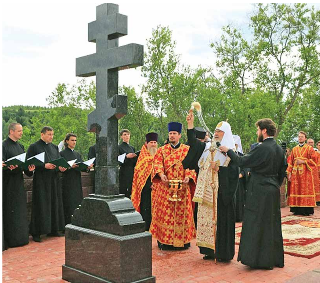
Патриарх Московский и всея Руси Кирилл освящает поклонный крест в селе Уса-Степановка