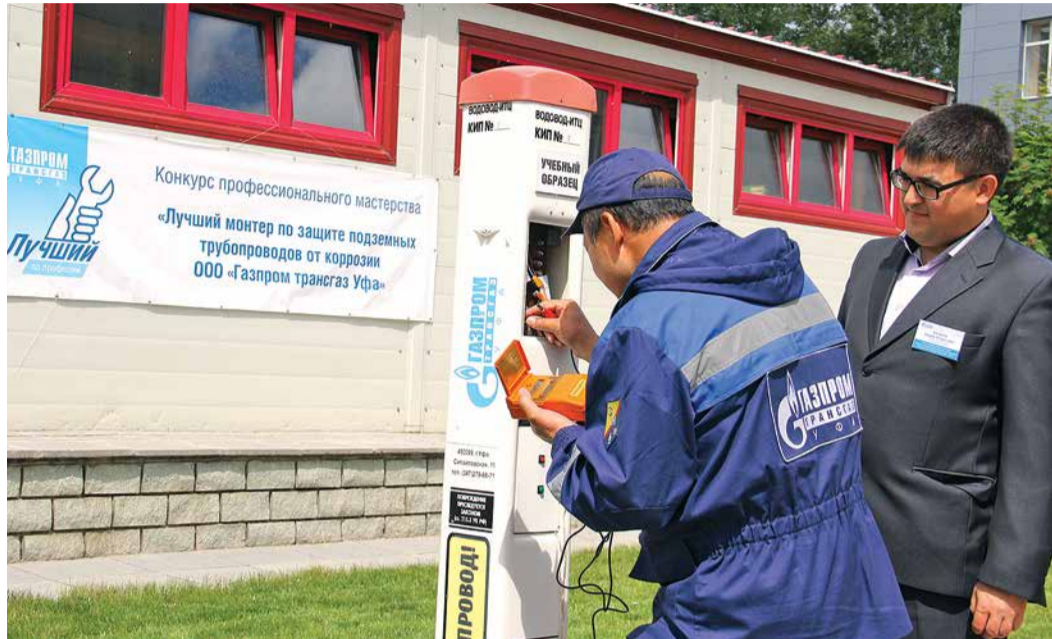
Соревнуются монтеры по защите подземных трубопроводов от коррозии

Дефицит квалифицированных рабочих кадров не обошел стороной, пожалуй, ни одно промышленное предприятие страны. В каждой компании эту серьезную проблему стараются решать по-своему. Действенную систему восполнения кадрового резерва выработали в «Газпром трансгаз Уфа». Здесь считают: самое главное – суметь сделать рабочие профессии привлекательными в глазах молодых. Вернуть былое уважение к слову «рабочий» помогают, в частности, конкурсы профессионального мастерства. Газотранспортники проводят их почти два десятка лет, вовлекая в соревнования весь спектр необходимых на производстве специальностей.