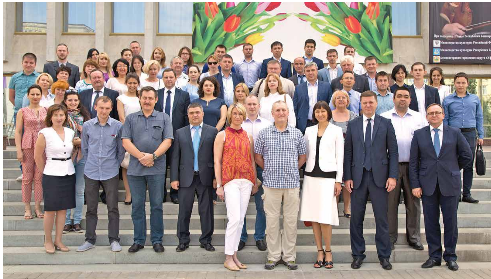
Памятное фото руководителей творческих делегаций дочерних обществ и организаций ПАО «Газпром»

16 июня в Уфе состоялось совещание руководителей творческих делегаций дочерних обществ и организаций ПАО «Газпром», которые примут участие в зональном туре VII корпоративного фестиваля «Факел» (состоится в столице Башкортостана с 15 по 22 октября 2016 года).