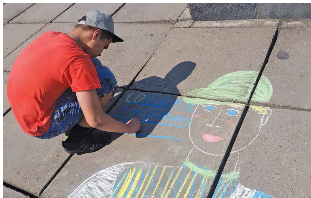
Конкурс детского рисунка на асфальте, организованный МСЧ