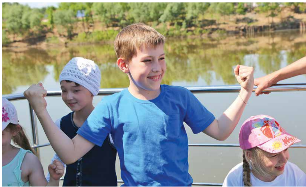
Такие встречи заряжают позитивным настроением на все каникулы