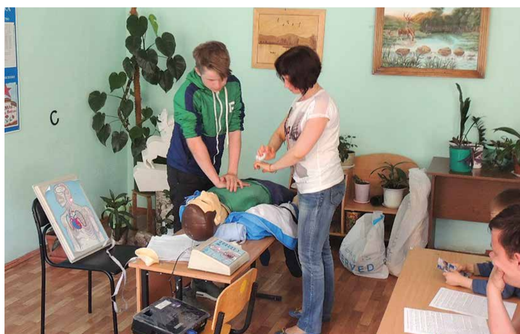
Благотворительное мероприятие в детском доме № 9 города Уфы