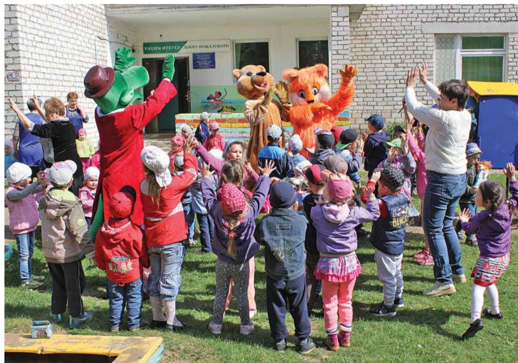
Работники УАВР устроили для воспитанников детсада «Ёлочка» в п. Лесхоз Уфимского района поучительную сказку