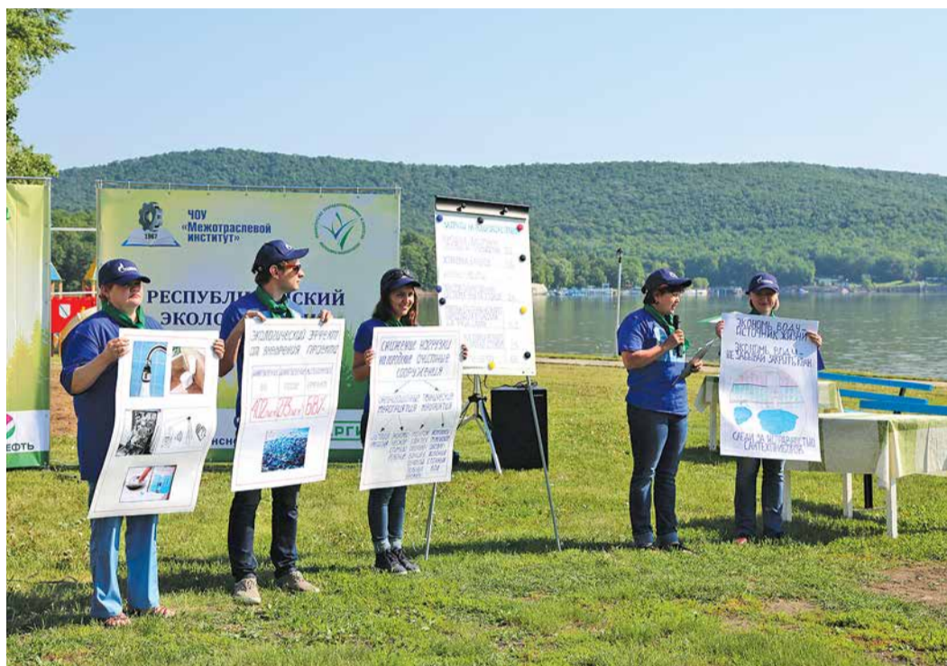
Команда Общества защищает свой экологический проект

– В Башкирии традиционно проводится конкурс «Лучший эколог», приуроченный к профессиональному празднику работников сферы охраны окружающей среды, – ознакомил присутствующих с предысторией фестиваля заместитель министра природо-