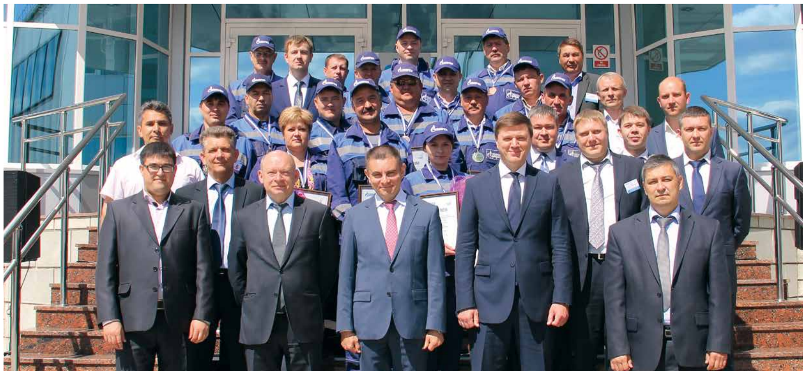
Победители конкурса с руководством ООО «Газпром трансгаз Уфа»