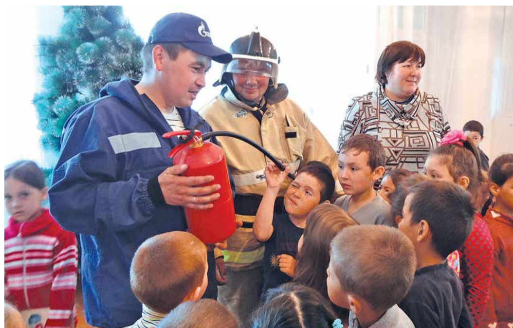
Занятия по безопасности жизнедеятельности для воспитанников детского сада «Радуга» с. Аркаулово