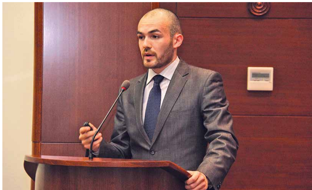
Возможность защищать дипломные проекты в стенах Общества выпадает лучшим из лучших выпускников УГНТУ

На протяжении многих лет опытные работники предприятия состоят в государственных экзаменационных комиссиях вузов региона,