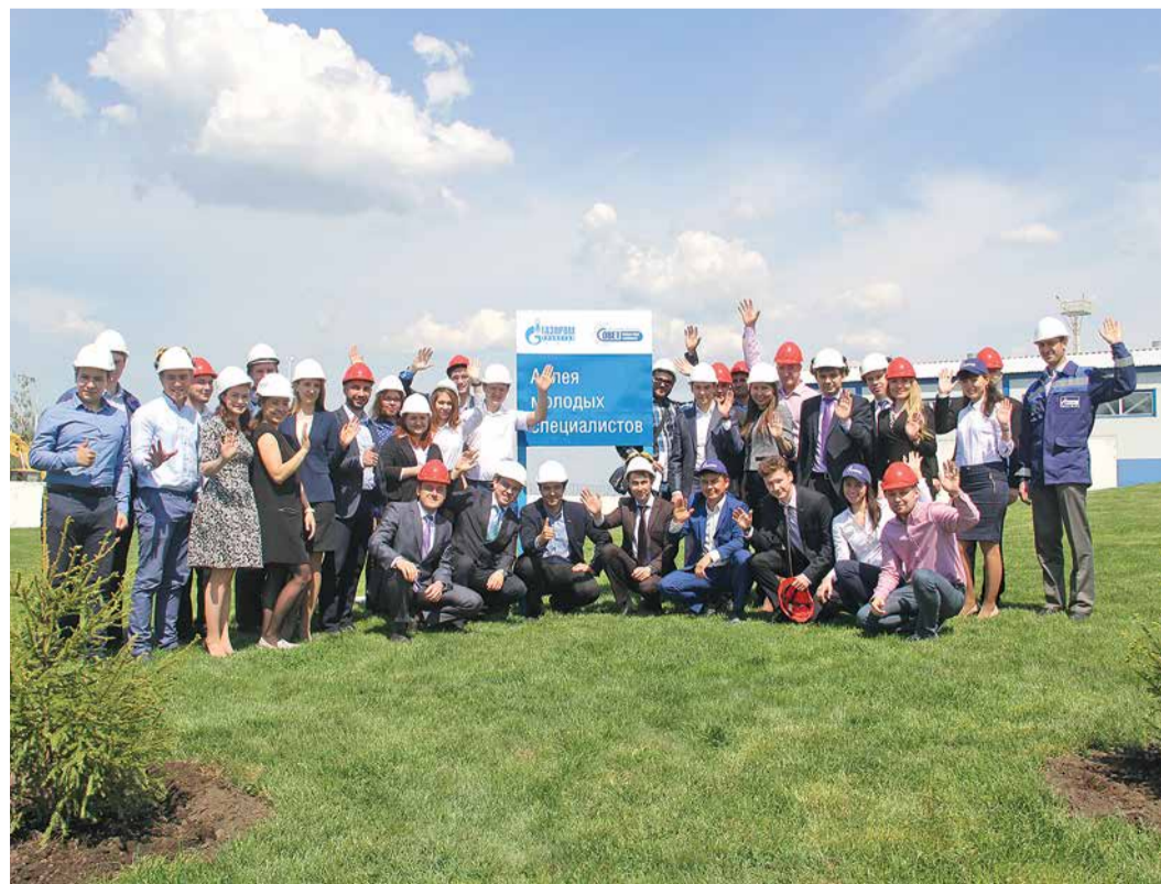
После закладки Аллеи молодых специалистов в Аркауловском ЛПУМГ

24 и 25 мая в Аркауловском ЛПУМГ прошло совещание советов молодых ученых и специалистов Общества. В нем приняли участие более 30 работников филиалов и подразделений Общества.