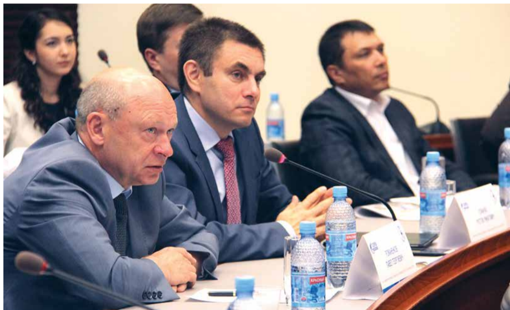
Вопросы производственников всегда на злобу дня