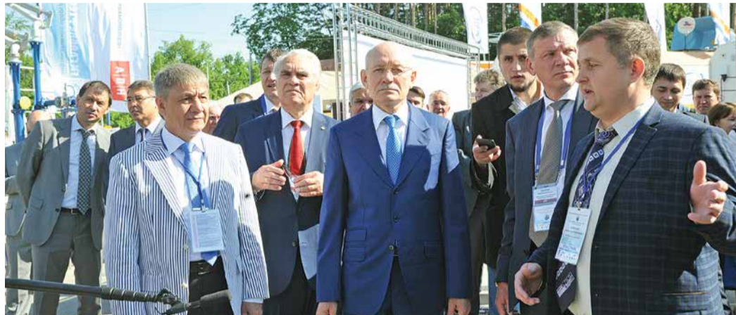
Глава РБ Рустэм Хамитов: «Сегодня нефтегазохимическая отрасль соответствует требованиям времени»

Уже стало доброй традицией, что в конце мая представители крупнейших компаний, связанных с главным богатством страны – нефтью и газом – собираются в Уфе на выставку «Газ. Нефть. Технологии». Многие из гостей не в первый раз приезжают сюда, и ход выставки, которая в этом году проводилась в двадцать четвертый раз, им хорошо знаком. Но в 2016 году привычный формат мероприятия был изменен – выставка стала составной частью первого Российского нефтегазохимического форума, пришедшего на смену «Большой химии».