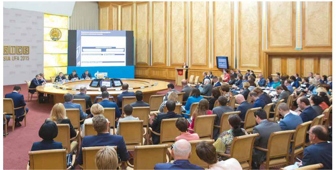
Совещание финансистов прошло в Конгресс-холле