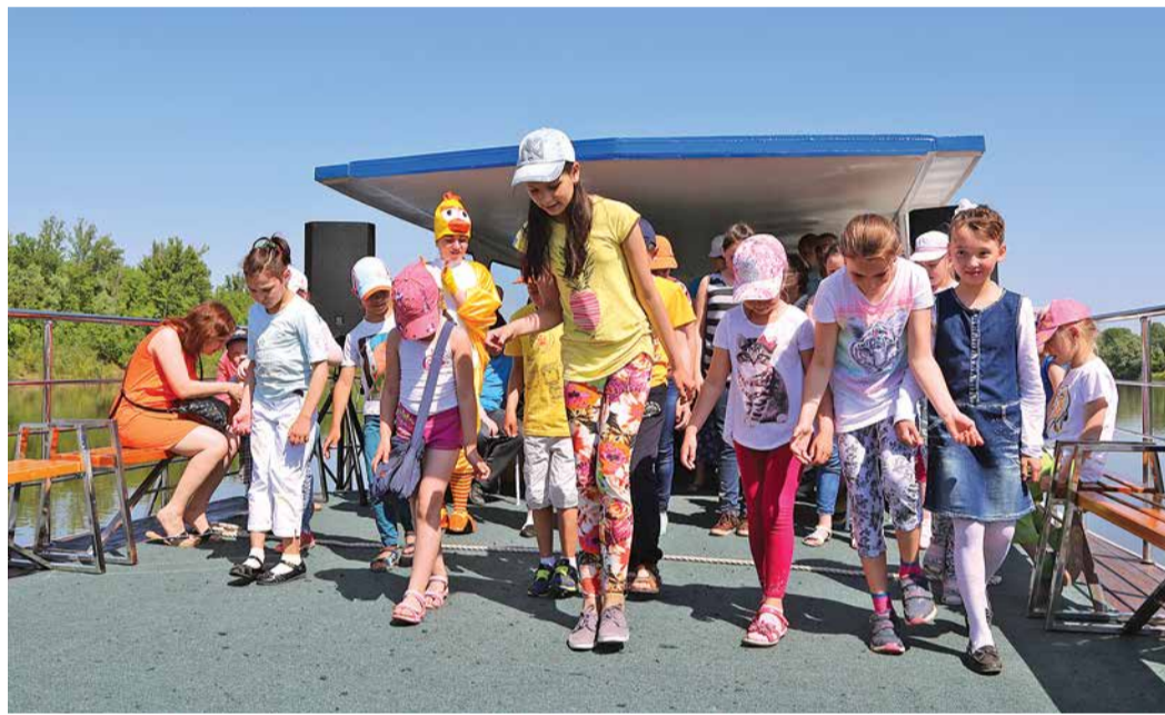
Прогулки на «Газовике» – весело и интересно