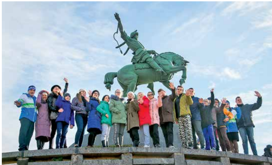
У памятника Салавату Юлаеву

Субботний день начался для большинства делегаций хлопотно. Программа фестиваля столь насыщенная, ведь кроме репетиций, для участников предусмотрены и экскурсии. Причем такие, какие было бы полезно послушать и самим уфичам.