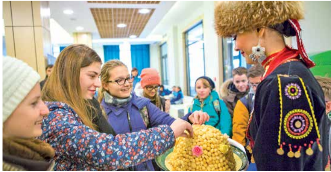
Башкирские красавицы угощают чак-чаком гостей