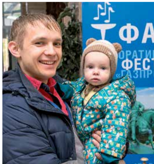
Будущая звездочка «Факела»

Участники «Факела» прибывают в столицу Башкирии весь день. В гостиницах каждую делегацию приветствуют девушки в национальных башкирских костюмах с чак-чаком. Церемония встречи, сопровождаемая живой мелодией курая, приводит в восторг абсолютно всех прибывающих участников фестиваля.