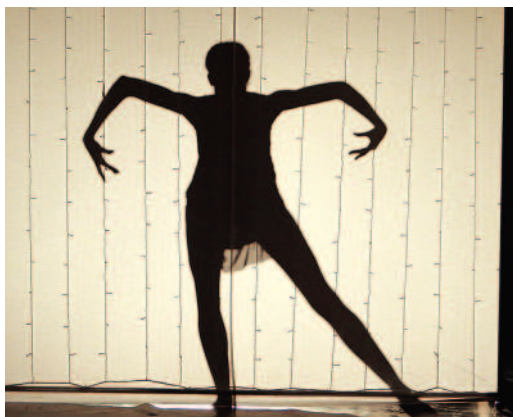
Специально для номера создана уникальная конструкция

Высокая, хрупкая, грациозная девушка, много раз отрепетировав свой номер, сидела в ожидании выступления и волновалась. Станиславе Лебедевой из ООО «Газпром трансгаз Саратов» выпало открывать второй фестивальный день.