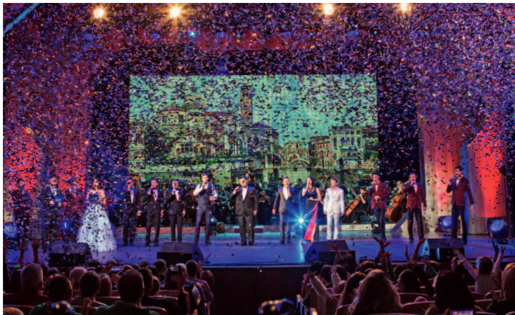
VII корпоративный фестиваль «Факел» в Уфе объявляется закрытым!

Главная концертная площадка Уфы гудела, как будто здесь выступали звезды мировой величины. Полный аншлаг! Хотя давайте будем честны (и все журналисты со мной согласятся): участники уфимского «Факела» безумно талантливы и заслужили эти бурные овации. Зональный тур VII корпоративного фестиваля «Факел» в Уфе подошел к своему логическому завершению – идет церемония закрытия.