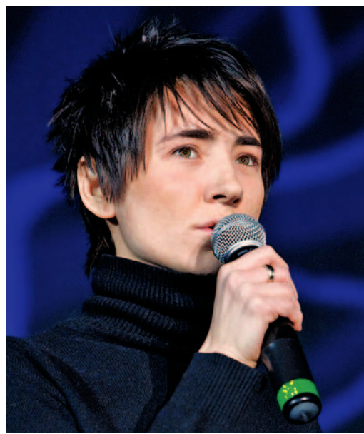
Творческий путь начинала в уфимских ресторанах

Российская рок-певица, музыкант, композитор, продюсер и автор песен Земфира Рамазанова родилась 26 августа 1976 года в Уфе. Представляем пять фактов из ее биографии.