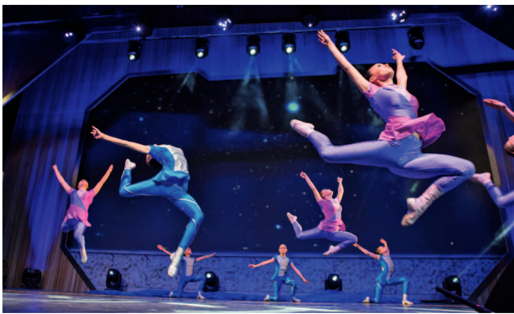
Церемонию закрытия фестиваля украсили номера победителей

– Так получилось, что наш город благодаря поддержке «Газпрома» стал центром очень большого огня, который называется «Факел». И вокруг него собрались те, кому действительно дорого творчество, кто знает цену дружбе, знает, что такое настоящее искусство и служение своему делу. От имени Правительства Республики Башкортостан благодарю газовую компанию за то, что оказали республике такую честь. Спасибо всем участникам, что приехали. Это очень большая радость для нас! – сказал вице-премьер Правительства Республики Башкортостан