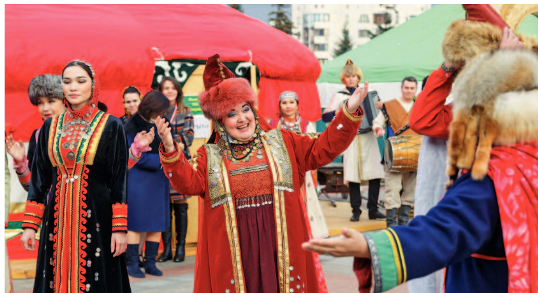
Один из ярких моментов фестиваля – знакомство с культурой башкирского народа

Свадебные обряды у всех народностей России – события яркие и непредсказуемые. Башкирский свадебный обряд – не исключение, в чем в пятницу убедились гости фестиваля. Площадь перед входом в ГКЗ «Башкортостан» в один миг превратилась в сцену, а собравшиеся вокруг зрители стали участниками захватывающего действия.