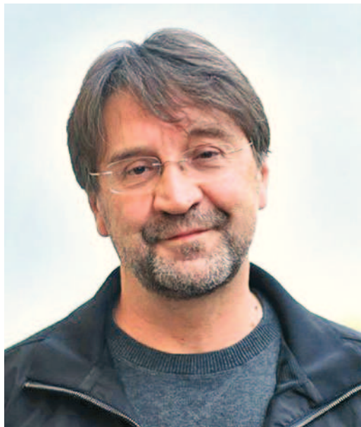
Юрий Шевчук – легенда российского рока

Советский и российский рок-музыкант, поэт, композитор, актер, художник и продюсер жил в Уфе с 1970 по 1985 годы. Представляем пять интересных фактов из его биографии.