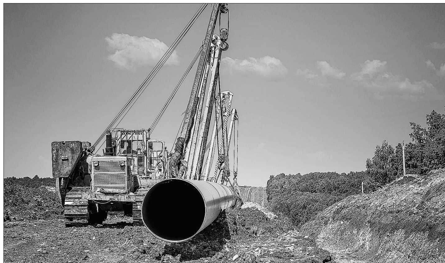
В 2018 году ООО «Газпром трансгаз Уфа» показало качественную и эффективную работу.

К годовому Общему собранию акционеров ПАО «Газпром» газотранспортное предприятие республики подходит с хорошими результатами