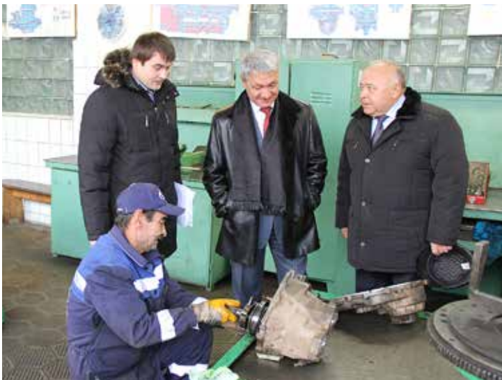
Участок ремонта автомобильных агрегатов

Страницу подготовила Ольга ЗУБАЧЕВСКАЯ.