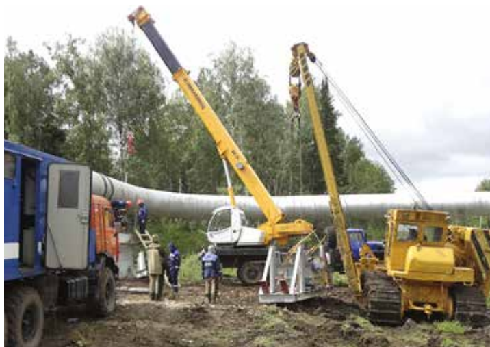
Замена опор в Аркауловском ЛПУМГ: все идет по плану

Работы стартовали в июне 2012 года, когда в ходе ППР «Сургутский II» были установлены две дополнительные опоры. В 2013 году была заменена опорная часть одной опоры, а в июле 2014 года – трех. До конца текущего года планируется заменить еще одну опору, а в последующие два года – оставшиеся восемь.