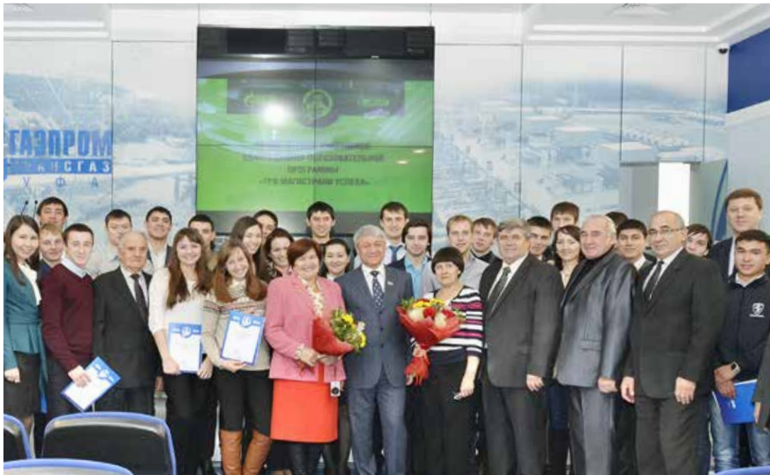
Участники программы «Три магистрали успеха» - 2014

ООО «Газпром трансгаз Уфа» удостоено I места в номинации «Лучшая система работы с молодежью» конкурса «Лучшие из лучших» - 2014 на создание достойных условий работы для молодежи в организациях Республики Башкортостан, проводимого Министерством молодежной политики и спорта РБ совместно с Федерацией профсоюзов РБ. Эта новость совпала с традиционным ежегодным обучением по адаптационно-образовательной программе «Три магистрали успеха» (первый модуль) для молодых специалистов, принятых на работу в Общество в 2014 году. «ГАЗета» расскажет об особенностях мероприятия.