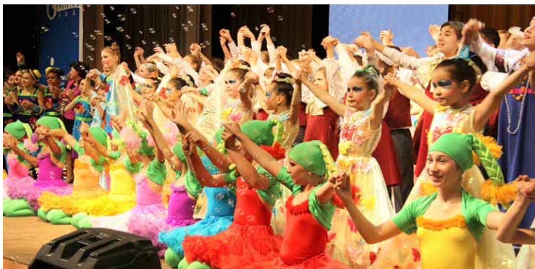
В творчестве все равны

Под таким девизом 14 ноября в Конгресс-холле Уфы прошел второй межрегиональный фестиваль детского творчества «Ломая барьеры», собравший более 200 здоровых ребят и детей с ограничениями в здоровье из Башкортостана, а также из городов Поволжья.