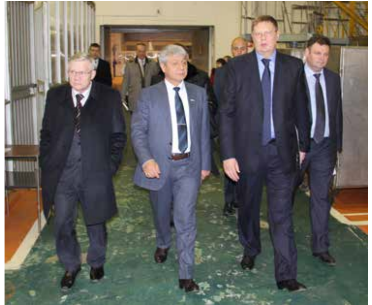
Капремонт АЛ-31СТ в УМПО идет по графику