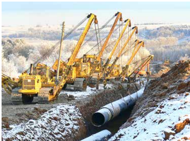
Заменено 26 км трубопроводов

Работа по подготовке к зиме проходила в соответствии с утвержденным планом. На сегодняшний день выполнены все основные запланированные мероприятия. Филиалы ООО «Газпром трансгаз Уфа» получили паспорта готовности к ра-