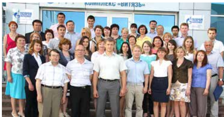
Дружному коллективу любая задача по плечу

Основная задача ПКБ сегодня – своевременное обеспечение проектно-сметной документацией объектов строительства и капиталь-