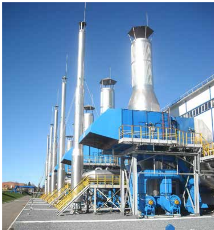
КС-4 Поляна. Замена двигателей АЛ-31СТ продолжается

Напомним, что благодаря сотрудничеству ООО «Газпром трансгаз Уфа» и ОАО «УМПО» создан резерв двигателей АЛ-31СТ, используемых в транспортировке газа. В соответствии с установленными графиками на машиностроительном предприятии продолжается дальнейшая доработка приводов.