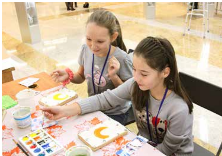
Территория творчества для юных художниц