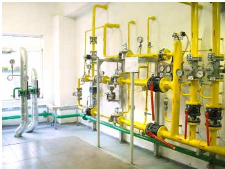
Котельная Стерлитамакского ЛПУМГ после капитального ремонта