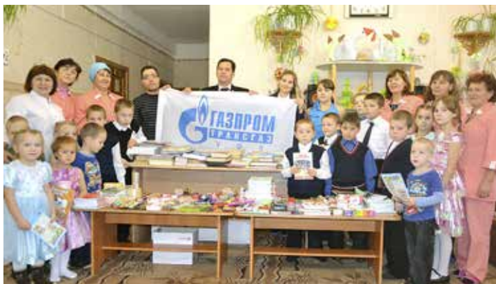
Желанные подарки – для детворы