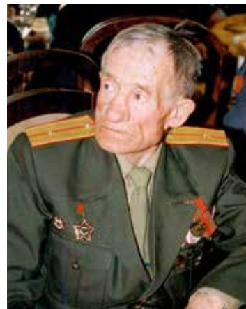
9 Мая – народный праздник

В 1981 году семья вернулась на родину. В только что созданном Шаранском управлении «Баштрансгаза» требовались