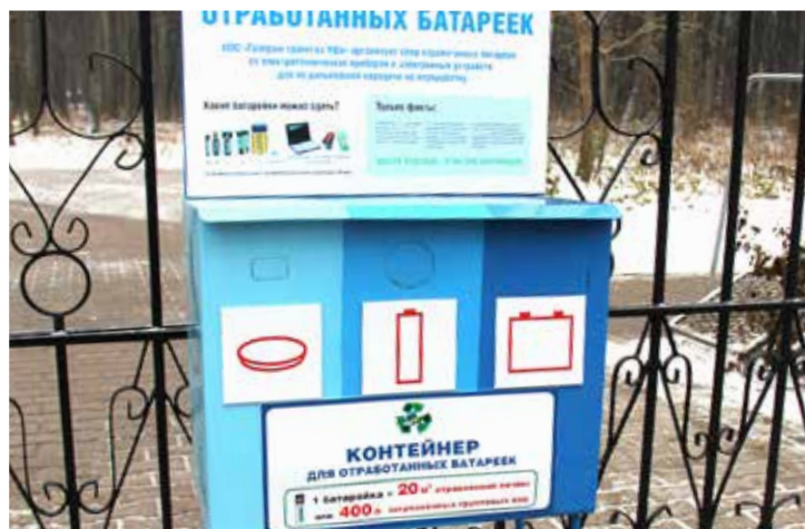
Контейнер, установленный в КАЗС

Переработка 10 кг щелочных батареек дает столько цинка, сколько обработка 96 кг цинковой руды. 80% выбрасываемых батареек – именно щелочные, а это уже тонны цинка и марганца, неконтролируемо попадающих в почву и грунтовые воды. На свалках батарейки и аккумуляторы становятся опасны через шесть-семь недель, когда под воздействием температуры и влаги из-за коррозии нарушается герметичность их металлической оболочки.