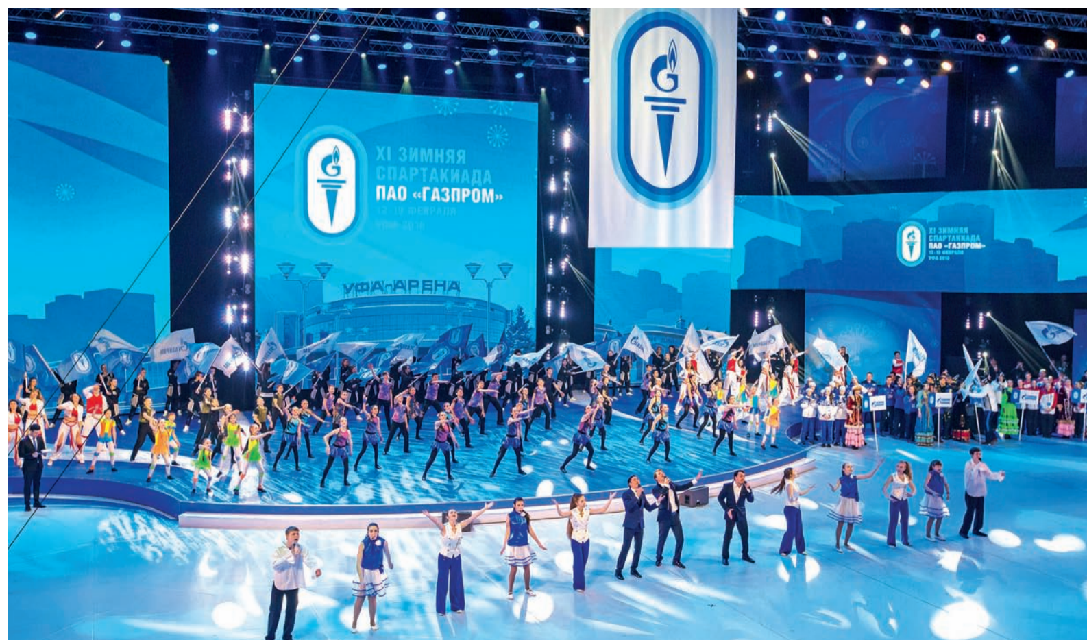
XI зимняя Спартакиада ПАО «Газпром»-2016 открыта!

артистов приняли участие в открытии XI зимней Спартакиады ПАО «Газпром»-2016