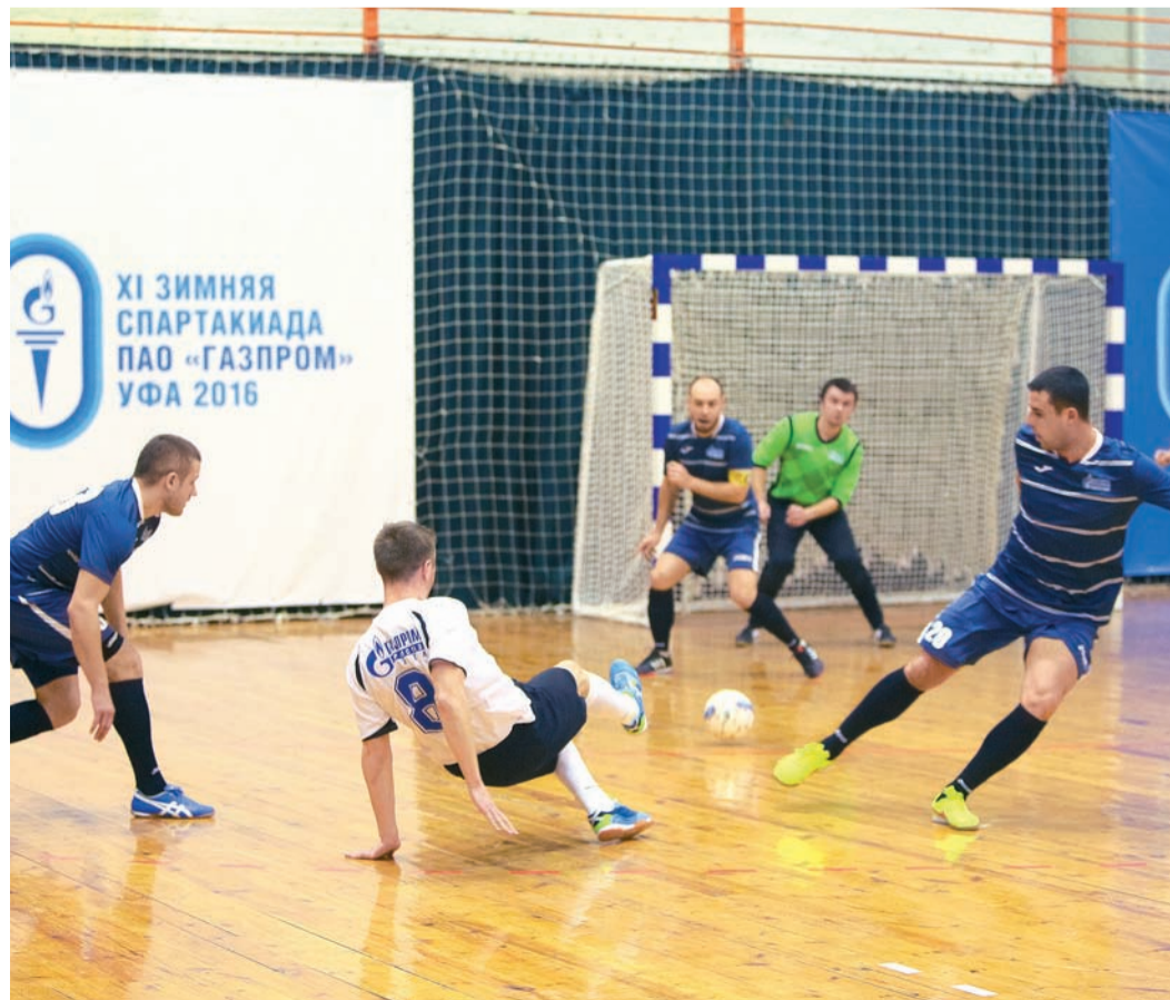
Красивый атакующий футбол

Гульчачак РАФИКОВА.