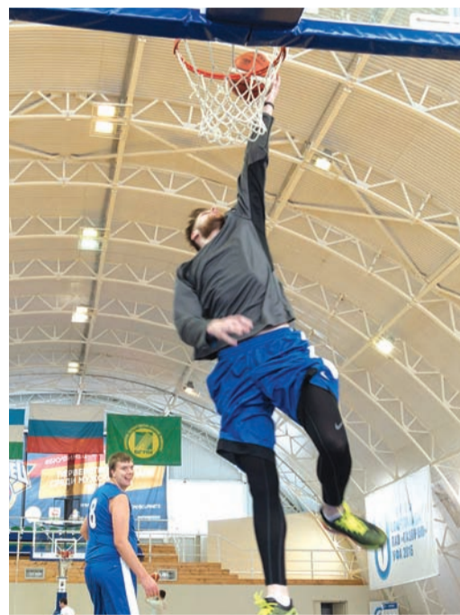
Мяч — в корзину

Самые высокие и стройные представители «Газпрома» собрались этим морозным утром в спортивном комплексе Башкирского аграрного университета. Баскетбол для них давно уже не просто хобби, а образ жизни.