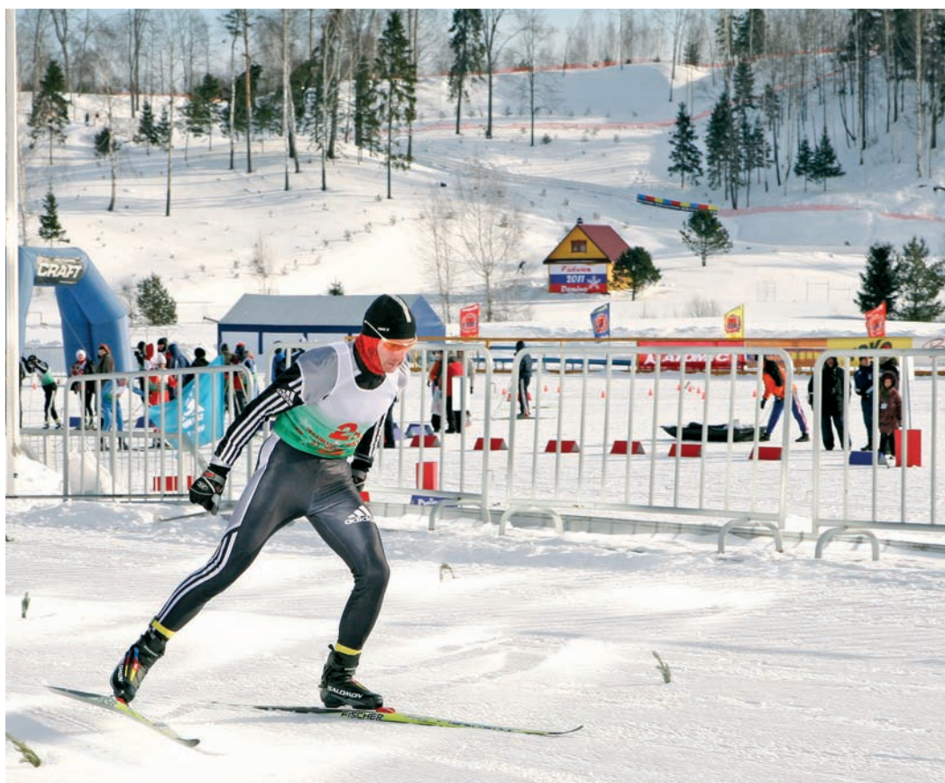
Из династии лыжников

Каждый вид спорта хорош по-своему. Но есть такая дисциплина, которая закладывает в человеке способность достигать высот везде, где он пожелает. Речь идет о лыжных гонках. Именно лыжная школа делает из спортсмена универсала, который и легкоатлетическую эстафету пробежит, и заплыв на стометровку одолеет, и забьет несколько точных голов в ворота соперника.