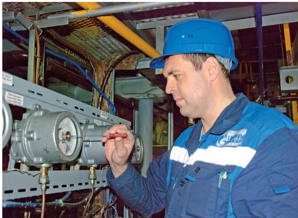
Свое дело надо выполнять хорошо