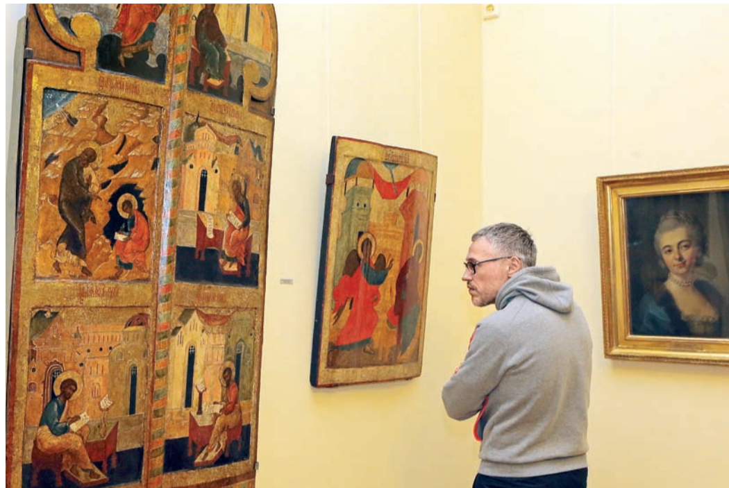
Музей Нестерова покориł гостей

Белорусские спортсмены вчерашний вечер провели с большой пользой – они совершили обзорную экскурсию по Уфе, познакомились с южной частью столицы Башкирии. Гости узнали о древней истории города, которая в годы правления Ивана Грозного была крайней восточной границей российской земли.