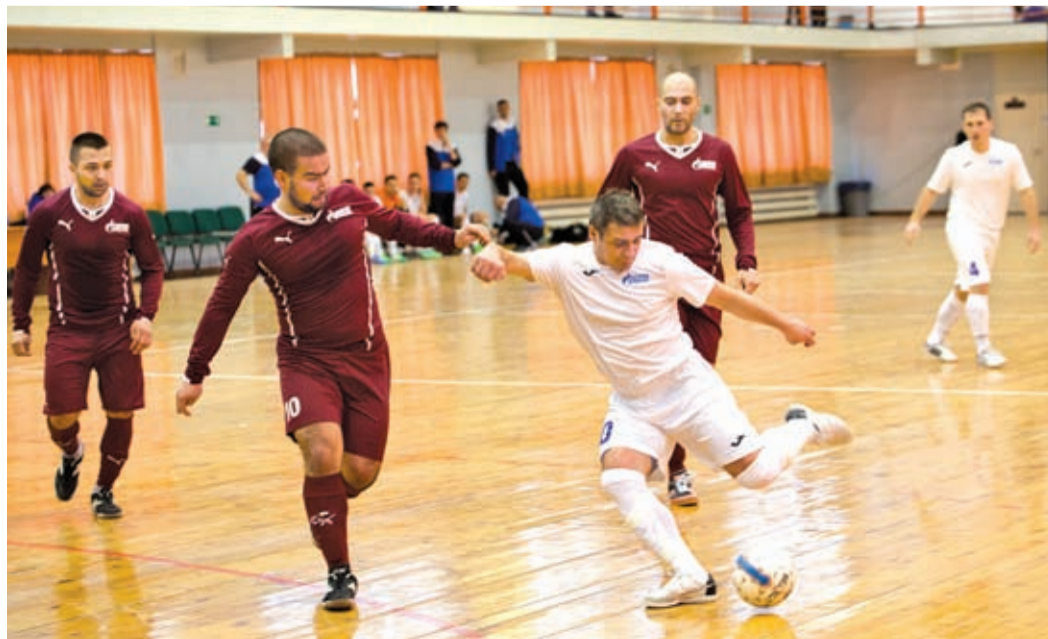
Борьба за мяч