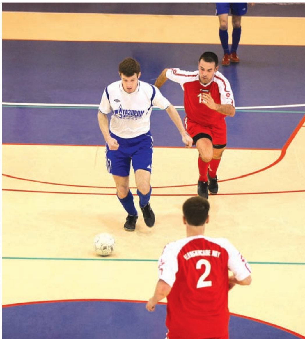
Игра в самом разгаре