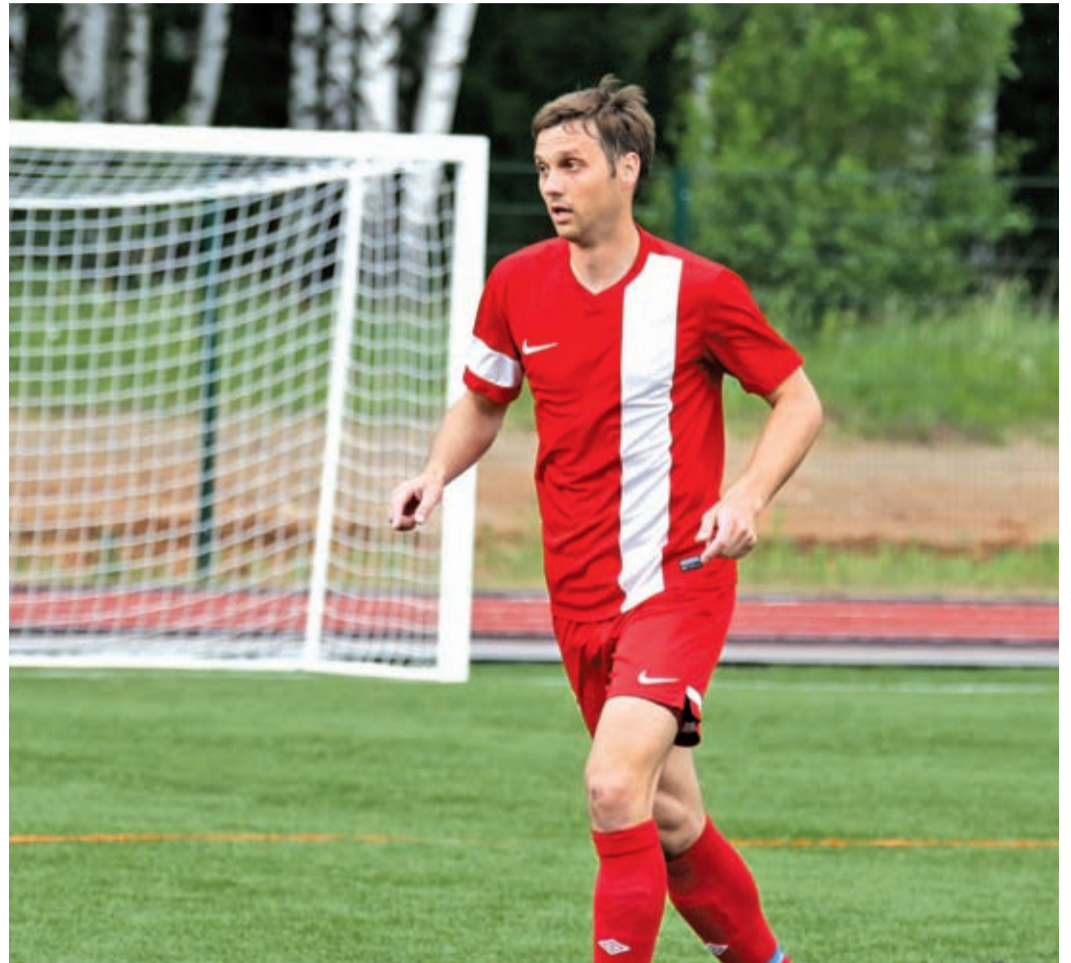
Сегодня уже в новом амплу