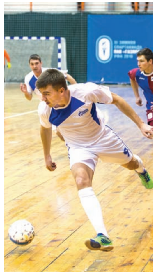
Есть шанс на победу!