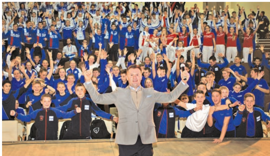
Самое массовое селфи

Никто не подозревал, что сам Алексей Немов придет к ним на встречу! Ребят, отдыхающих после стартов в гостиничных номерах санатория «Зеленая Роща», пригласили на «Вечер знакомств». Сюрприз готовился в тайне даже от их тренеров и кураторов. У команд было задание – к мероприятию выйти на сцену со своей презентацией. Кто-то заранее готовил выступление еще дома, до приезда в Уфу, а некоторые уже экспромтом, за пару часов до начала, придумывали свою «визитную карточку».