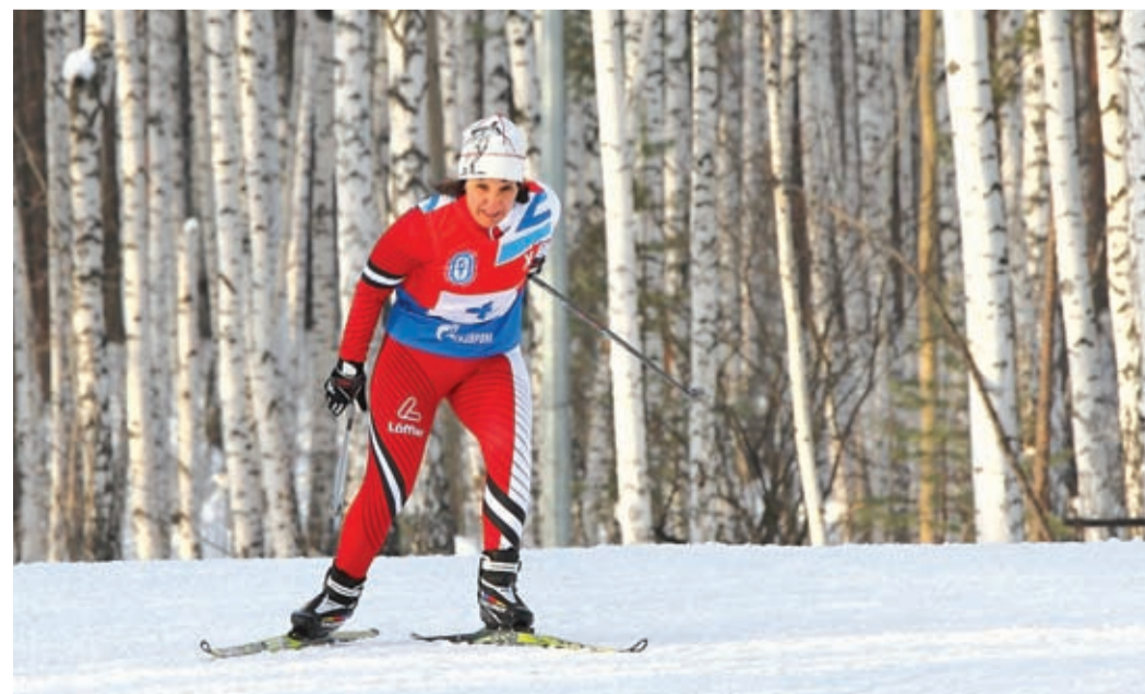
Крутые подъемы не страшны

Дальше был север, где стало понятно: по снегу особо не разбежишься. Впрочем, вскоре ее попросили принять участие в лыжных стартах за честь предприятия. Она и пробежала, как будто это был кросс.