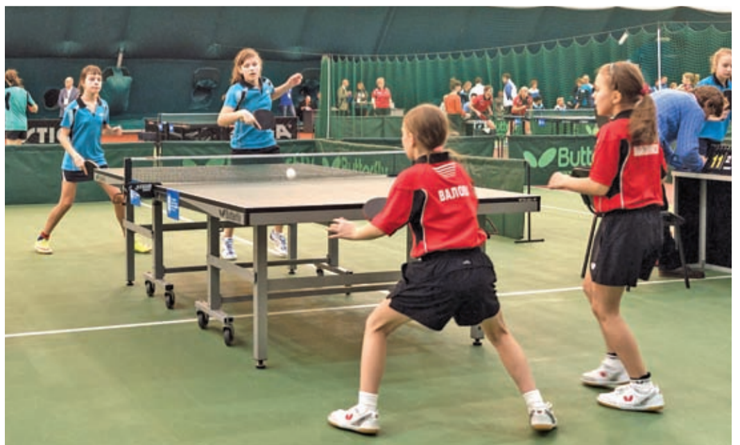
«Все равно возьмем реванш»