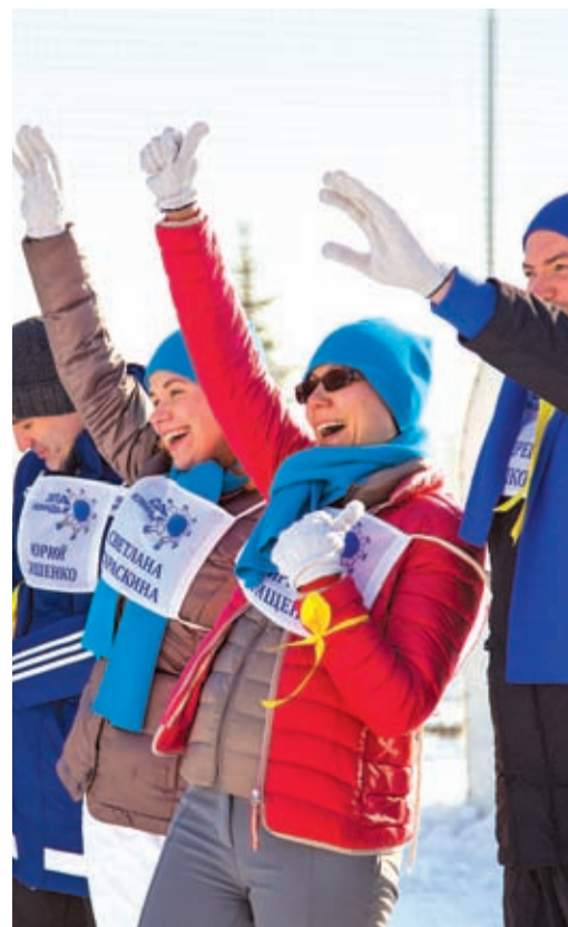
Все было здорово!

Официальная страховая компания XI зимней Спартакиады ПАО «Газпром»