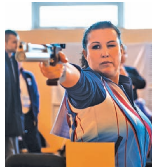
Вернись за победой

– Увидев масштаб Спартакиады, я осознала всю ответственность, которая возложена на меня. Даже ошиблась во время подготовки к стрельбе, за что судья сделал мне предупреждение. Это очень серьезные спортивные соревнования, к которым многие участники готовятся годами. 14-е место, которое я заняла, – для меня это победа. У меня были ошибки: топталась, оглядывалась, первой закончила стрельбу, тогда как настоящие профи не стреляли, если не были уверены в попадании «в десятку» на сто процентов. Я пока не стрелок. Но здесь