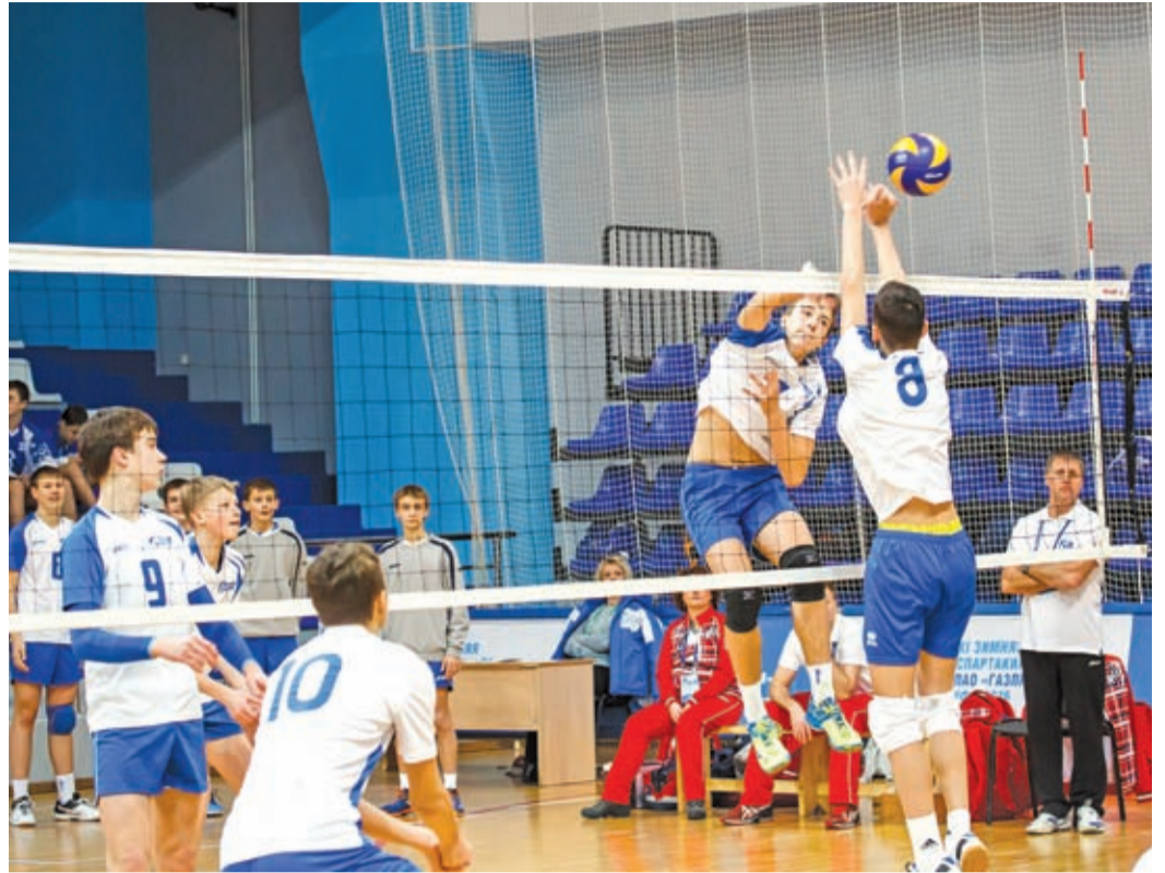
Мяч над сеткой