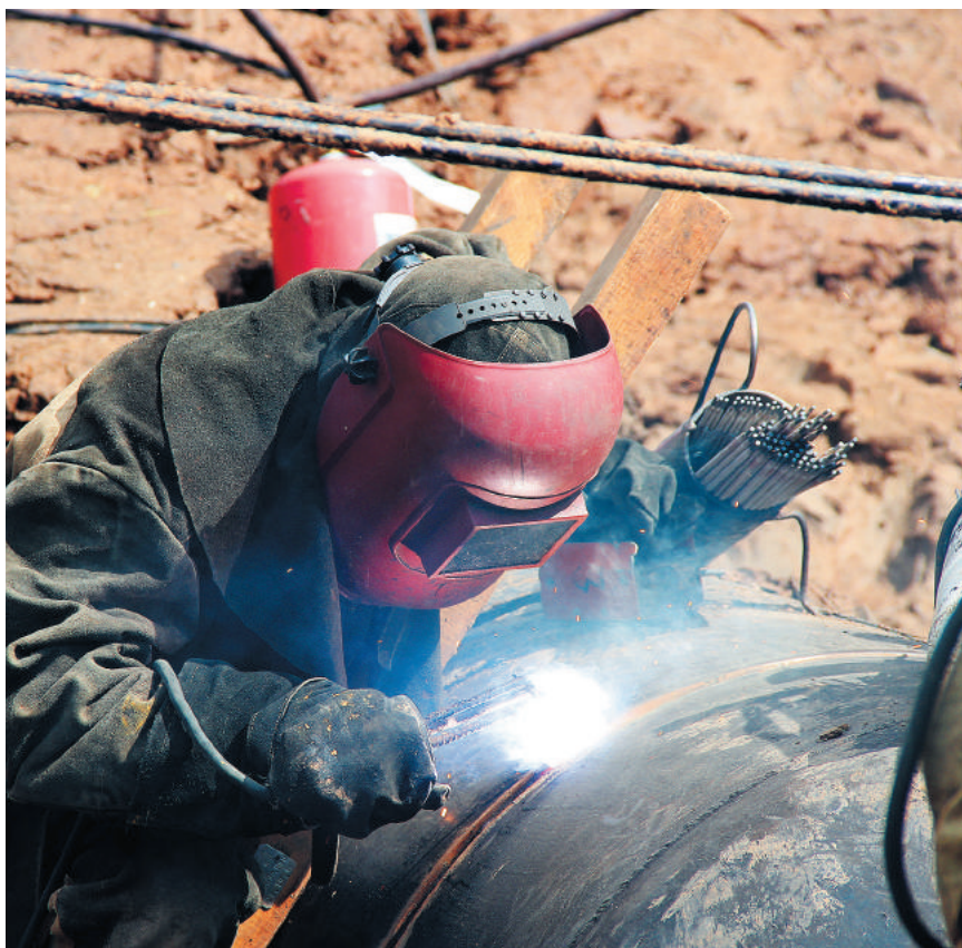
Огневые на МГ Уренгой–Новопсков

Эльвира КАШФИЕВА.