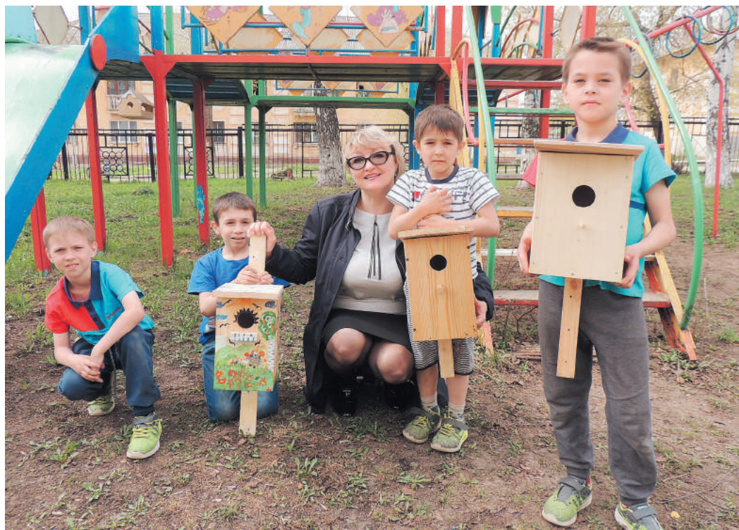
Домики для крылатых жильцов от УТТИСТ