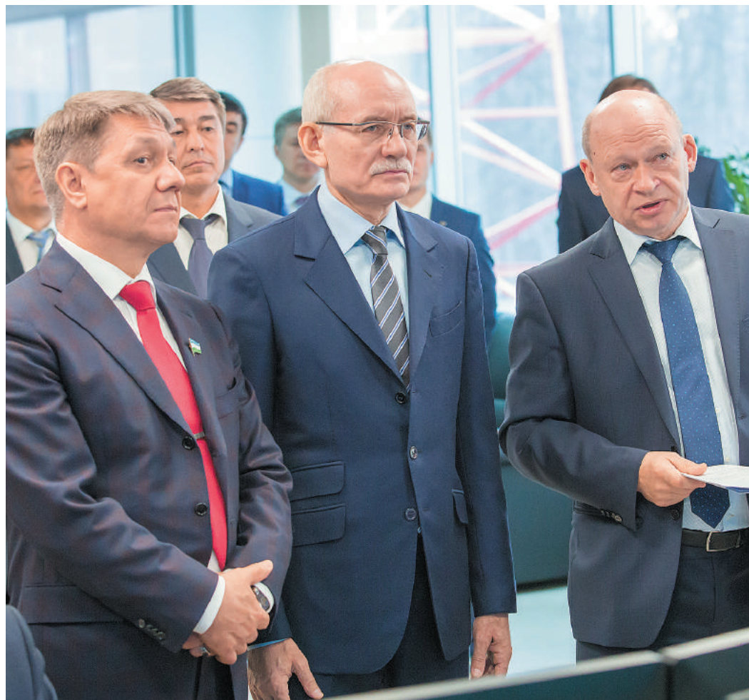
Визит Главы республики был приурочен к успешному окончанию отопительного сезона 2016–2017 гг.

является получение эффективного, надежного двигателя, который будет востребован газотранспортными предприятиями России.