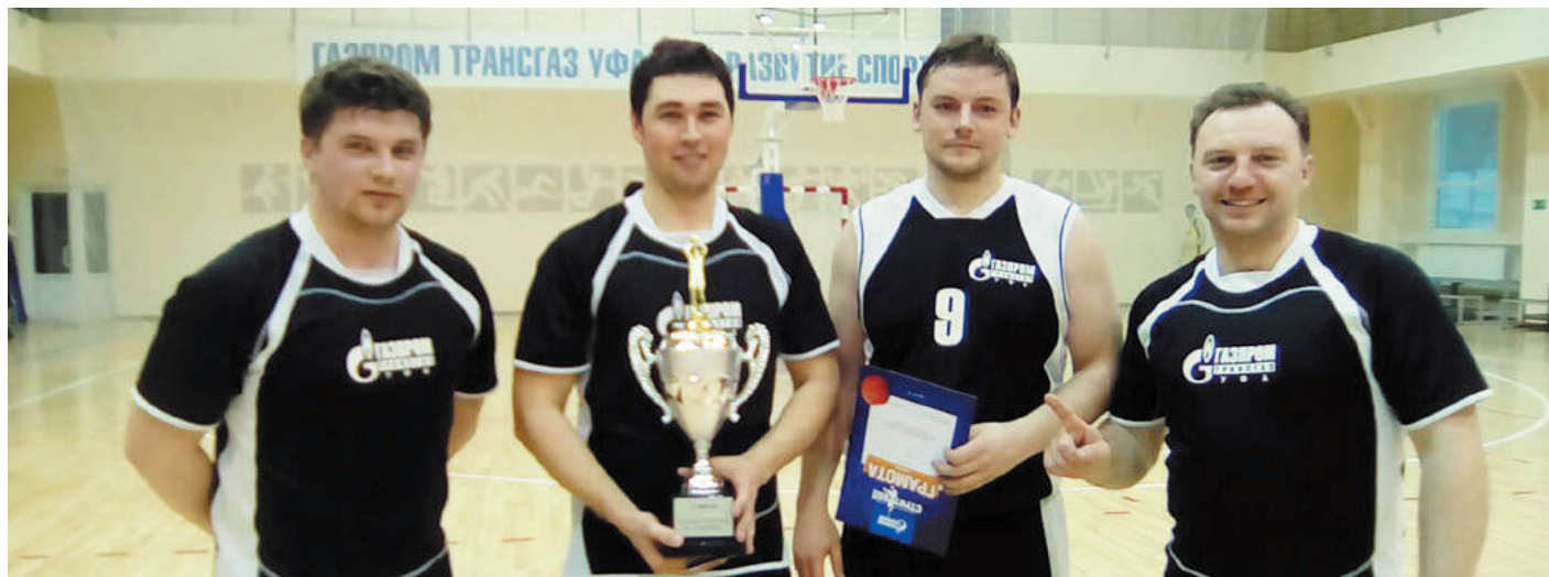
Переходящий кубок по стритболу остался у работников УМТСиК