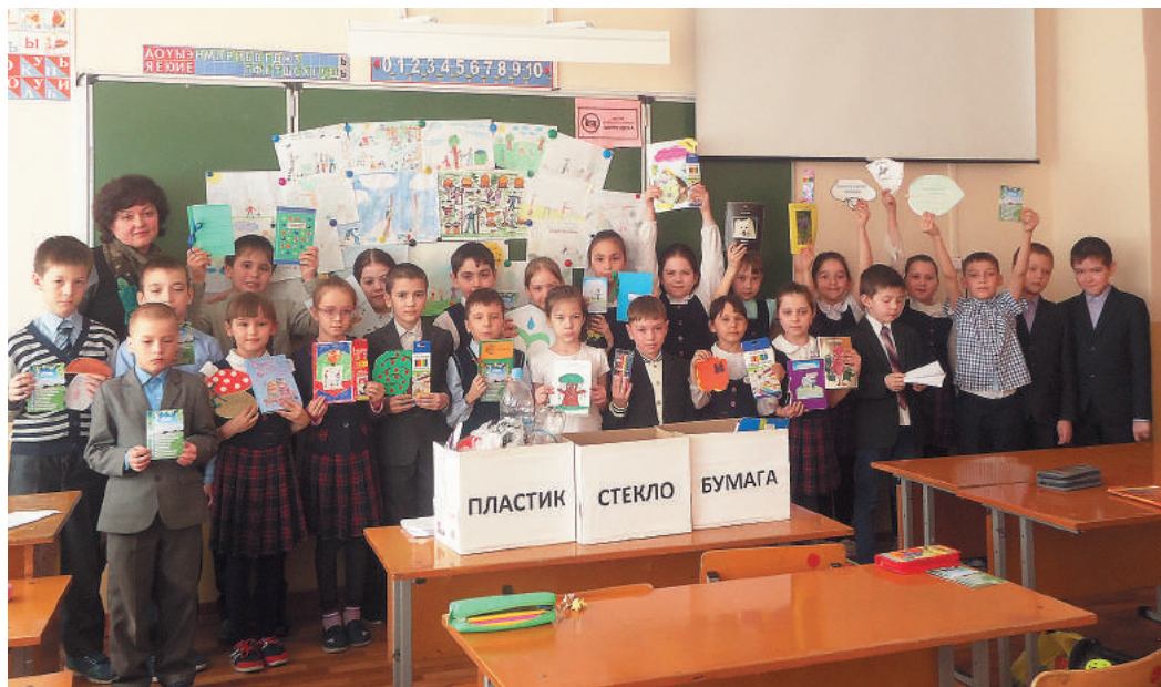
Для школьников прошли конкурсы на тему «Чем я могу помочь природе?»

Подготовила Ольга ЗУБАЧЕВСКАЯ.