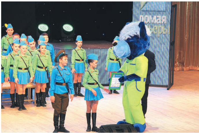
Проект «Ломая барьеры» известен далеко за пределами Башкортостана