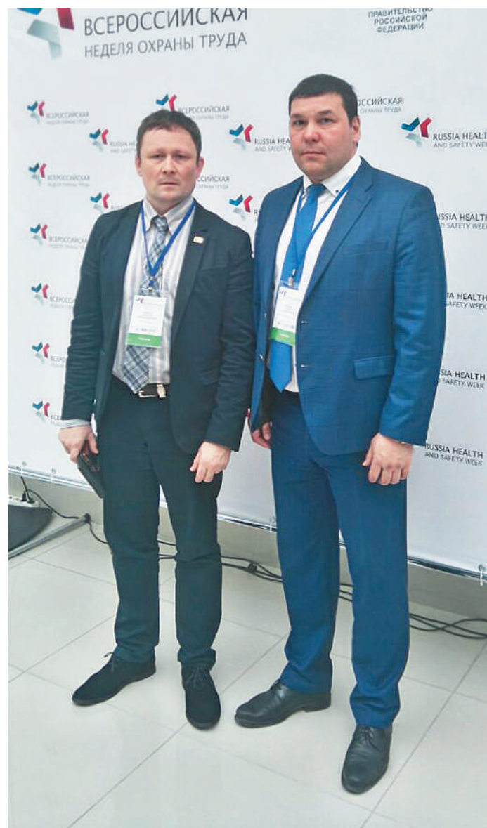
Делегаты от Республики Башкортостан