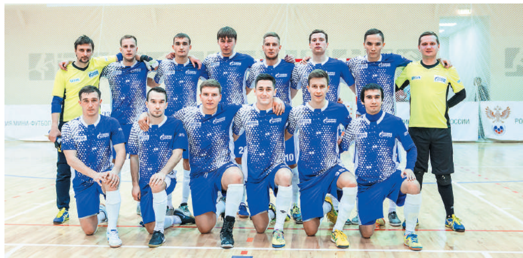
Отдыхать и расслабляться нашим футболистам точно не придется

Планы команды на будущее? Отдыхать и расслабляться нам точно не придется. Сразу по прибытии в родную Башкирию практически вся дружина мини-футбольного «Витязя-ГТУ» начала приобщение к новым реалиям. Наша команда будет выступать в третьем дивизионе первенства России по классическому футболу. Состав коллектива не изменится, произойдет лишь точечное усиление по позиции.