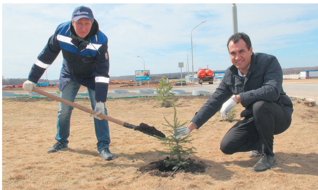
Работники УАВР провели традиционную посадку саженцев деревьев хвойных пород