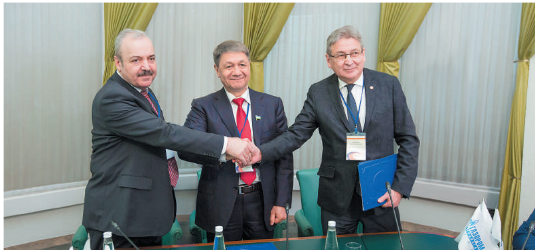
Дружественное рукопожатие сторон после подписания документа

«Газпром трансгаз Уфа», УГНТУ и УГАТУ будут вместе готовить специалистов для газовой отрасли. Соглашение о сотрудничестве в сфере образования газотранспортное предприятие и два ведущих вуза республики подписали 27 апреля в уфимском Конгресс-холле, где проходил V межрегиональный HR-форум «Человеческий капитал страны: вызовы региональной стратегии 2030».