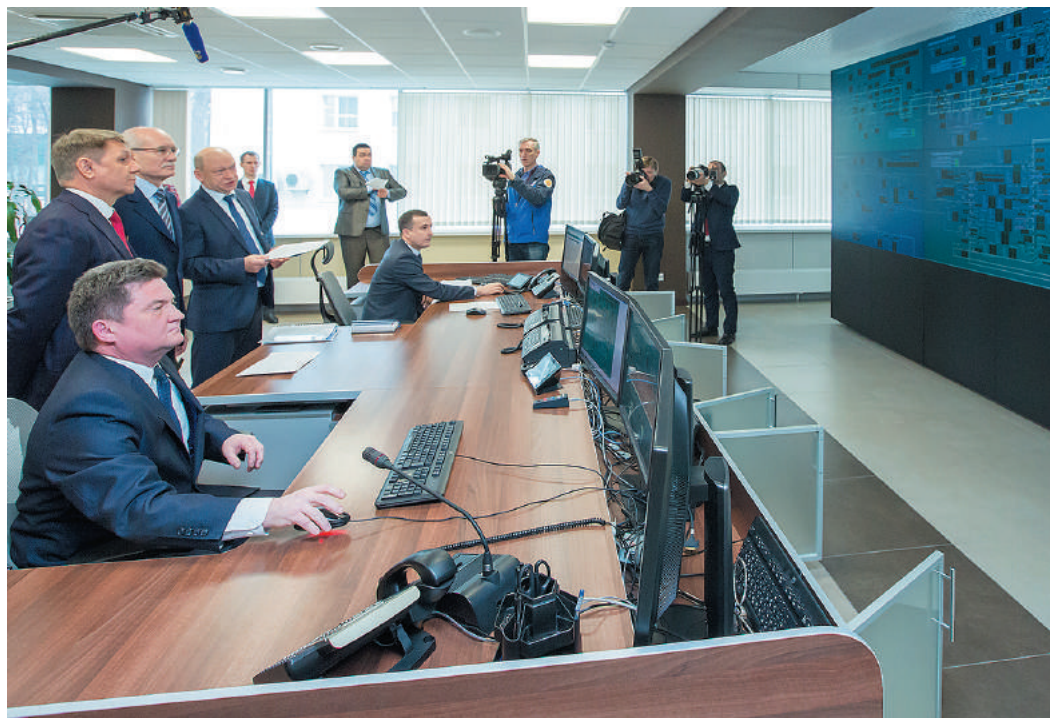
Система производственно-диспетчерского управления – гордость ООО «Газпром трансгаз Уфа»