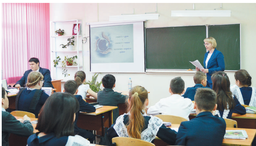
На лекциях работников ИТЦ и УМТСиК дети поняли, насколько важно любить и беречь природу