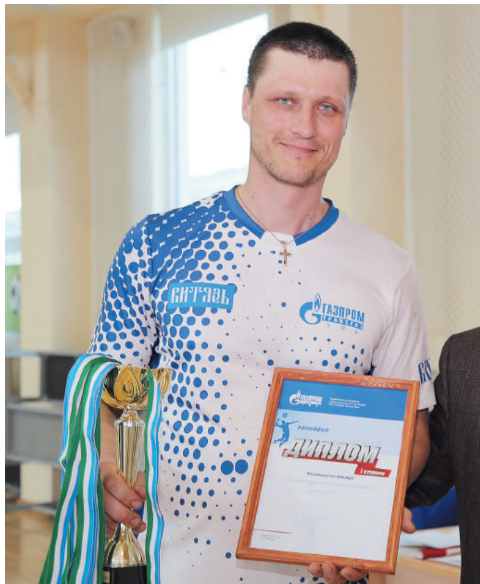
Первое место по волейболу – у работников Инженерно-технического центра Общества

Игры проходили на двух площадках в четырех группах. Первое место завоевали спортсмены Инженерно-технического центра, второе – у Администрации Общества, «бронзу» увезли кармаскалинцы. На 4, 5 и 6 местах расположились Сибайское ЛПУМГ, Управление технологического транспорта и специальной техники и Полянское ЛПУМГ соответственно.