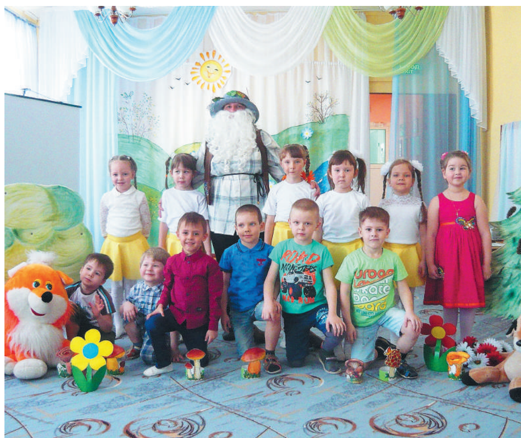
Утренник экологической направленности «В гостях у Лесовика»