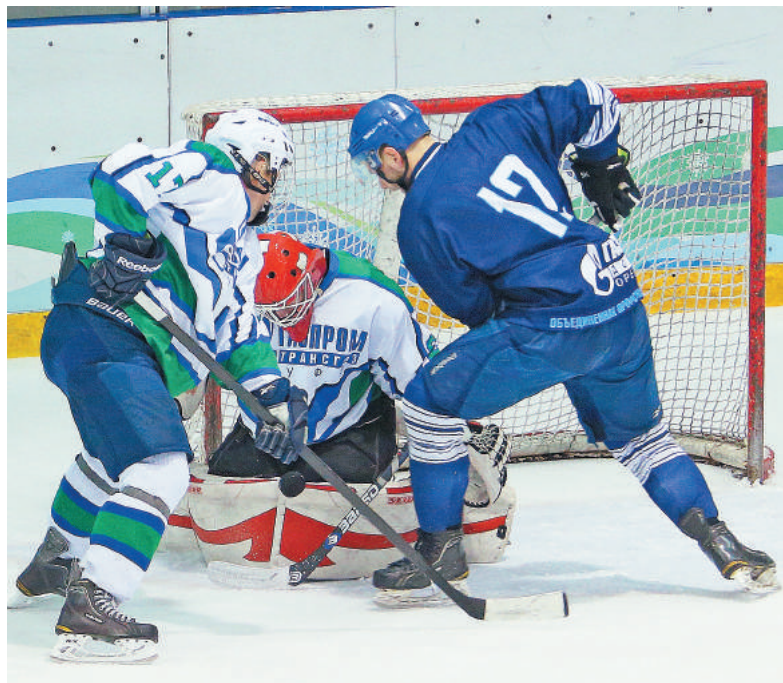
Встреча с ООО «Газпром добыча Оренбург»

За три дня болельщики увидели 10 ярких, не похожих друг на друга матчей. Вызов прежде всего самим себе бросили около 100 газчиков. Требования к участникам – 20 лет и старше, стаж работы на предприятии – не менее года.