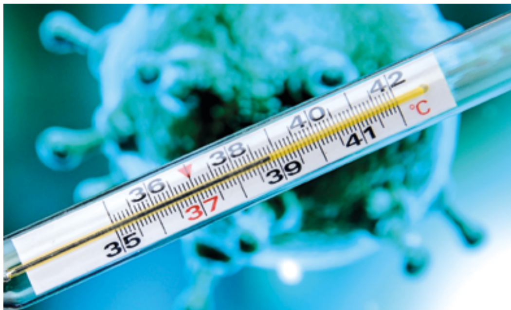
Повышение температуры – один из признаков инфекции

Медико-санитарная часть ООО «Газпром трансгаз Уфа» настоятельно рекомендует заранее планировать свои поездки за рубеж и воздержаться от поездок в Китай до стабилизации ситуации.