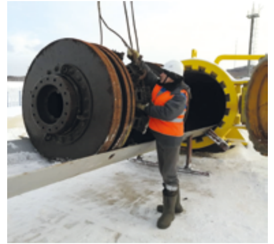
Подготовка поршня к запасовке

После завершения запланированных мероприятий сведения, полученные в ходе внутритрубной диагностики, будут использованы при формировании планов по капитальному ремонту. В случае обнаружения значительных дефектов при проведении комплексов планово-предупредительных ремонтов пройдут работы по их устранению.