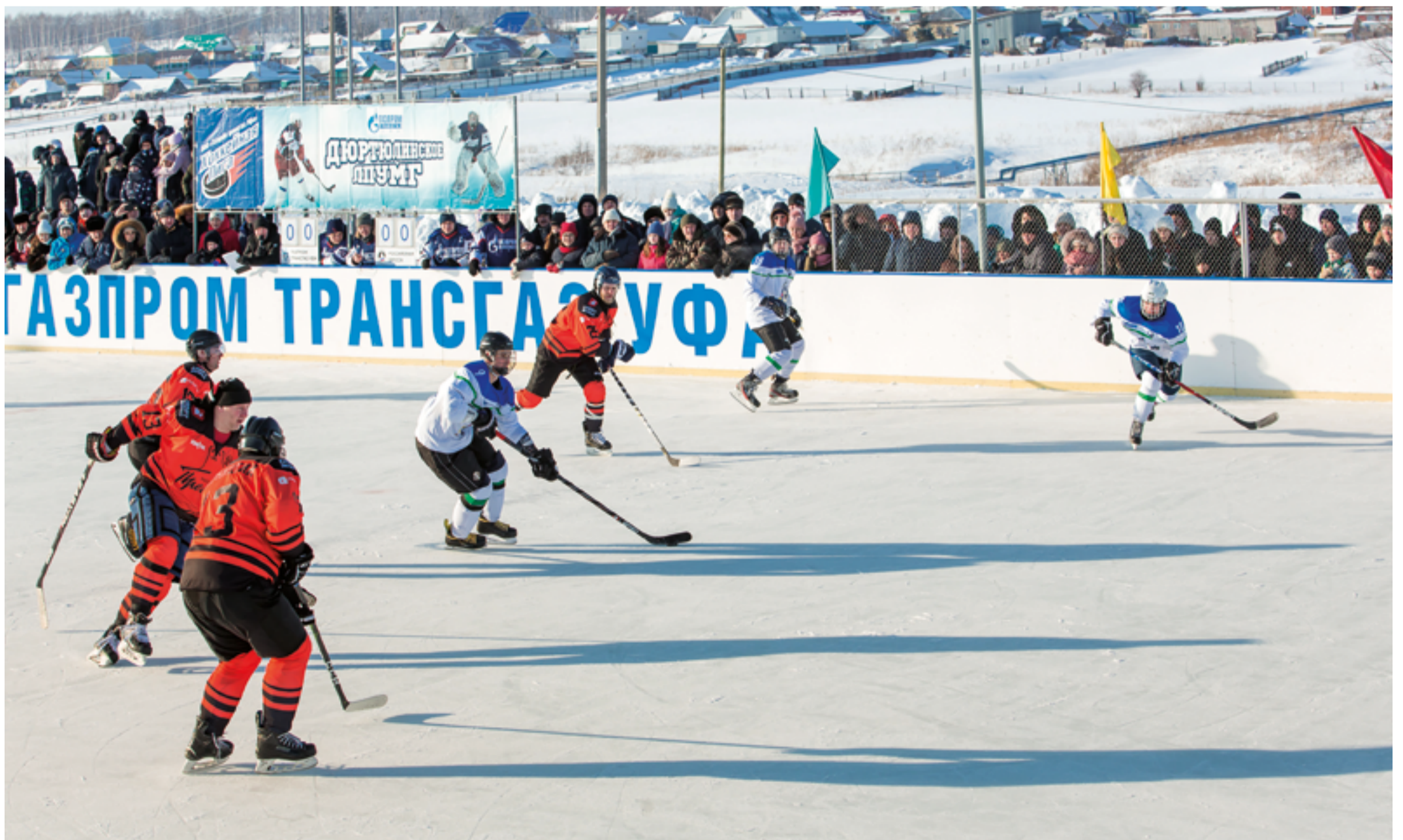
Матч между командами «Российская пресса» и «Газпром трансгаз Уфа»

У команды «Российская пресса» в Башкортостане есть хорошая традиция: проводить мастер-классы для детей. В этом году для юных хоккеистов был не просто шанс полу-