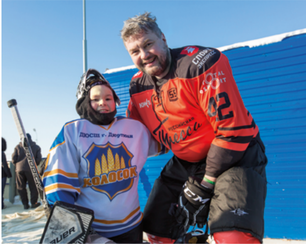
Маленькие друзья больших профессионалов

Встречи любителей спорта – работников га-