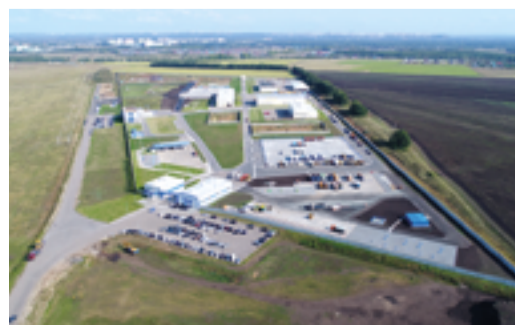
СИЛЬНОЕ ЗВЕНО стр. 3