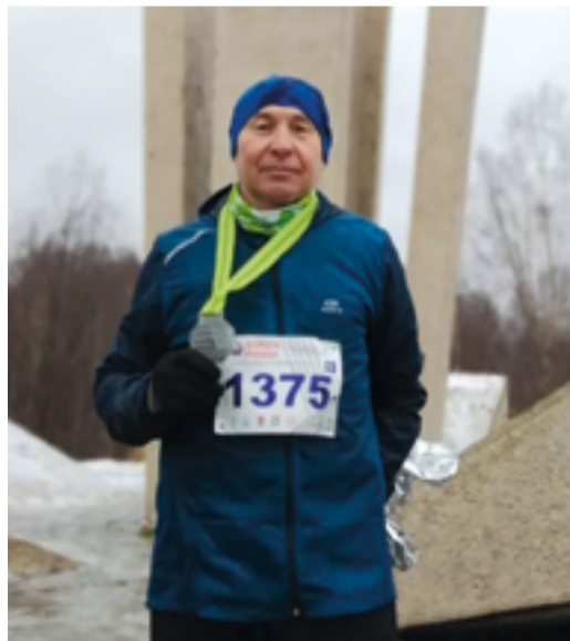
На финише «Дороги жизни»

В Санкт-Петербурге прошел 51-й Международный зимний марафон «Дорога жизни», посвященный 76-й годовщине полного освобождения Ленинграда от фашистской блокады. Участники забега почтили память жертв страшной трагедии, одним из символов которой стал дневник маленькой Тани Савичевой.