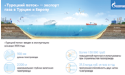
«Турецкий поток»: основные характеристики

«Газпром» в конце января поставил по газопроводу «Турецкий поток» первый миллиард кубометров газа. Около 54% из этого объема доставлены на турецкий газовый рынок, порядка 46% — на турецко-болгарскую границу. Проектная мощность экспортного газопровода — 31,5 млрд куб. м газа в год. Коммерческие поставки по «Турецкому потоку» начались 1 января 2020 года. 8 января в Стамбуле президенты России и Турции провели торжественную церемонию открытия объекта.