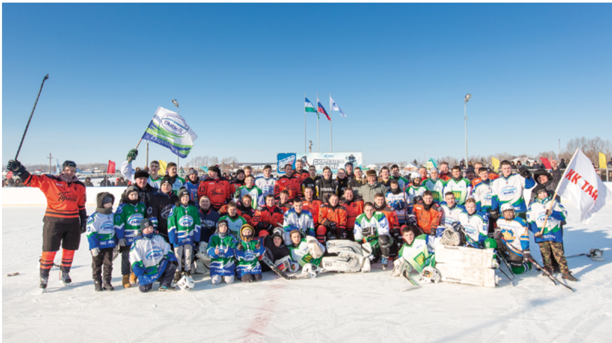
Москвичи и сборная районов Башкортостана

читать наставления именитых спортсменов, а возможность сыграть с ними на одном льду. Счастливицами оказались ребята спортшкол Дюртюлинского, Аскинского, Балтачевского и Татышлинского районов.