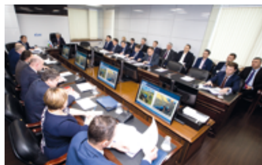
ЗИМНЯЯ СЕССИЯ стр. 2