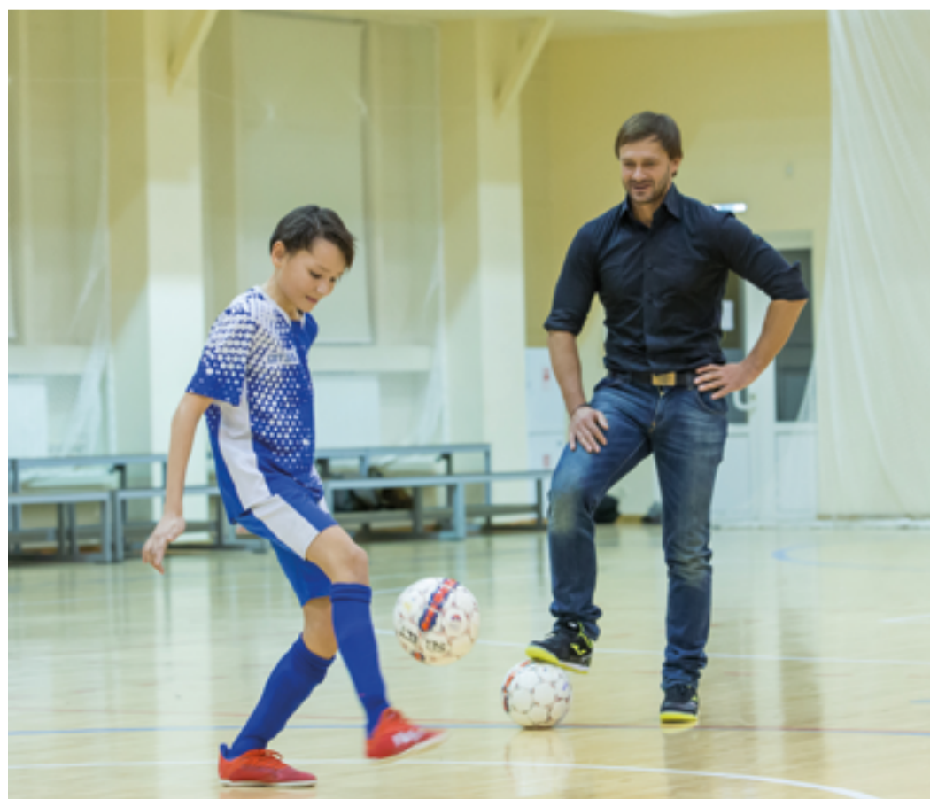
Уроки мастерства от именитого спортсмена