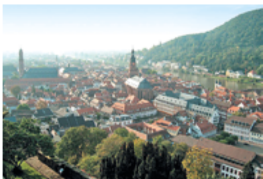
Более 50 лет Россия является надежным поставщиком природного газа в Европу

«Газпром» является крупнейшим поставщиком газа в Европу. В декабре компания впервые начала экспортировать трубопроводный газ в Китай. Кроме того, в Азиатско-Тихоокеанский и другие регионы поставляется СПГ из портфеля Группы «Газпром». Сведения о маркетинговой стратегии на зарубежных рынках были рассмотрены на заседании Правления компании. Среди конкурентных преимуществ «Газпрома»: богатейшая ресурсная база, развитая газотранспортная система в России и надежная система транспортных маршрутов для экспортных поставок.