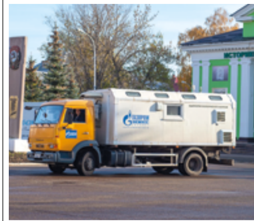
Передвижная экоаналитическая лаборатория

Компания «Газпром нефтехим Салават» установит в городе Салавате две автоматизированные станции для онлайн-мониторинга качества атмосферного воздуха. Проект реализуется в рамках Инвестиционного соглашения между Республикой Башкортостан и ООО «Газпром нефтехим Салават». Инвестиции компании в проект составляют более 64 млн. рублей. В состав станций входит современное оборудование: газоанализаторы оксидов азота, оксида углерода, оксидов сероводорода, аммиака, оксида серы, анализаторы пыли. Автоматические газовые хроматографы смогут определить наличие и концентрацию в атмосферном воздухе ароматических углеводородов, метанола, диметиламина, этилена и других загрязнителей. Кроме того, в станцию контроля загрязнения атмосферного воздуха встроена ультразвуковая метеостанция для автоматического измерения метеорологических параметров: температуры атмосферного воздуха, относительной влажности, атмосферного давления, количества осадков.