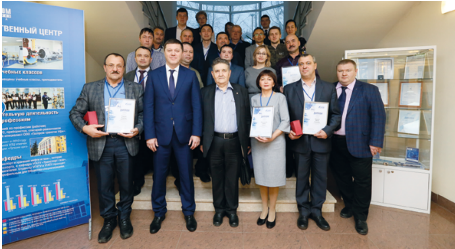
Первый конкурс наставников показал свою значимость

В современных реалиях, когда конкуренция на рынке труда за квалифицированные кадры особенно высока, необходимо обеспечить непрерывные процессы адаптации для принимаемого персонала, в особенности для молодых работников: важно настроить их на овладение практическими знаниями и умениями без отрыва от профессиональной деятельности.