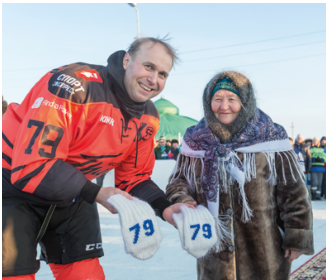
Теплый подарок из Москово