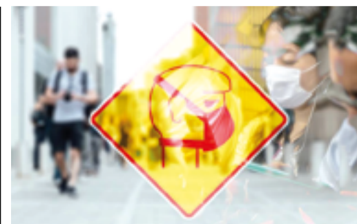
КОРОННЫЙ ПРИЕМ - ПРОФИЛАКТИКА стр. 8