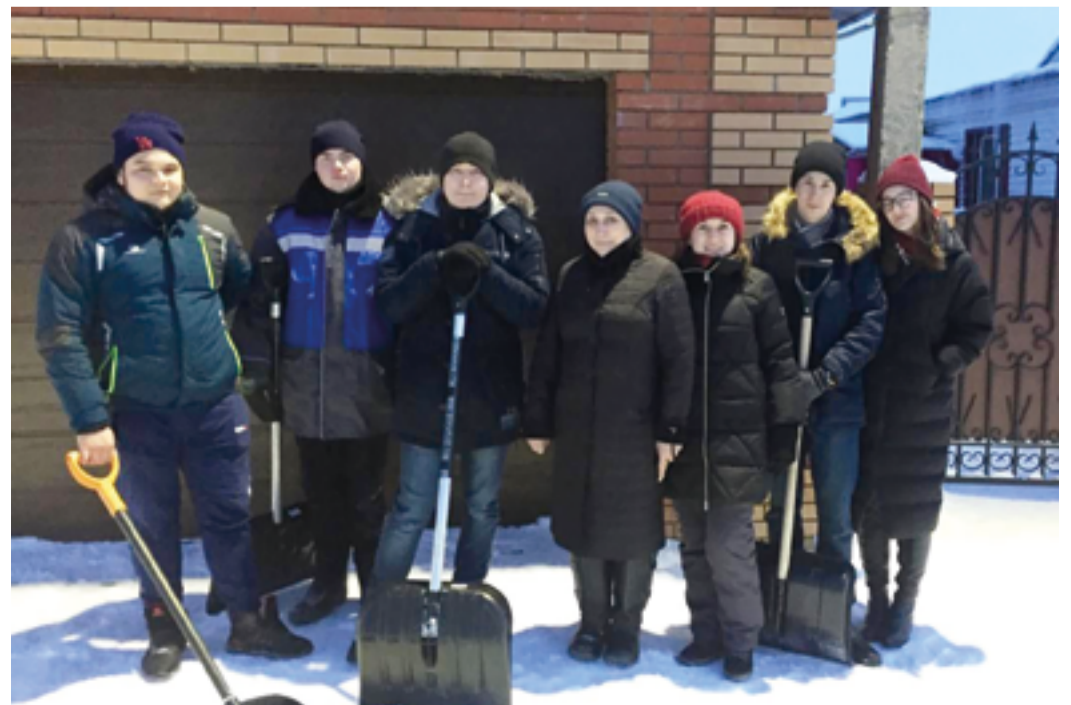
Чистые дорожки – от молодых работников