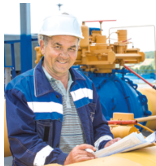
Коллектив УАВР: слав опыта и энергии

В рамках подготовки объектов предприятия к осенне-зимней эксплуатации группой по восстановлению теплотехнического оборудования выполнен ремонт подогревателей газа, также проведены обследование и ремонт секций аппаратов воздушного охлаждения масла. Восстановлены роторы и опорные подшипники скольжения центробежных компрессоров газоперекачивающих агрегатов в Дюртюлинском, Кармаскалинском и Ургалинском филиалах.