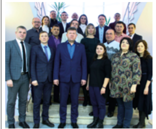
Участники учебно-методического сбора

На предприятии состоялся учебно-методический сбор по гражданской обороне, чрезвычайным ситуациям и мобилизационной подготовке, организованный специальным отделом. В ежегодной встрече приняли участие представители филиалов предприятия с целью планирования мероприятий по ГОЧС и мобилизационной подготовке на 2020 год. Они обсудили вопросы проведения тактико-специальных, противоаварийных учений и тренировок, порядок взаимодействия с муниципальными образованиями Республики Башкортостан в ходе предупреждения и ликвидации возможных ЧС. Были затронуты темы подготовки руководящего состава, членов комиссий по чрезвычайным ситуациям и обеспечению пожарной безопасности, а также работников, входящих в состав нештатных формирований Общества.