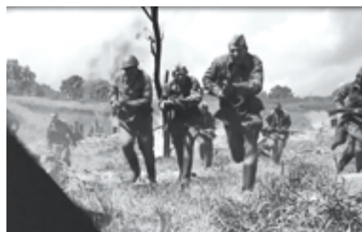
ГЛАВНАЯ ПРЕМЬЕРА стр. 7