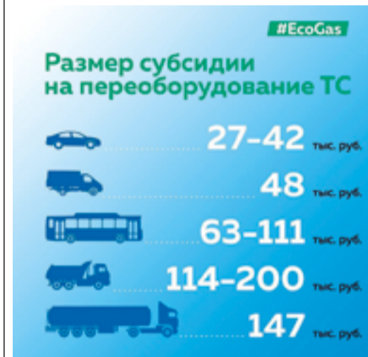
Метан – это экономия!

Башкортостан вошел в число регионов, жители которых смогут воспользоваться льготными условиями по переходу к использованию природного газа в качестве моторного топлива. Для этого в период 2020-2022 гг. будет выделено более 2,7 млрд рублей из федерального и региональных бюджетов на софинансирование мероприятий по переоборудованию техники. Размер субсидии зависит от массы, класса и года выпуска транспортного средства.