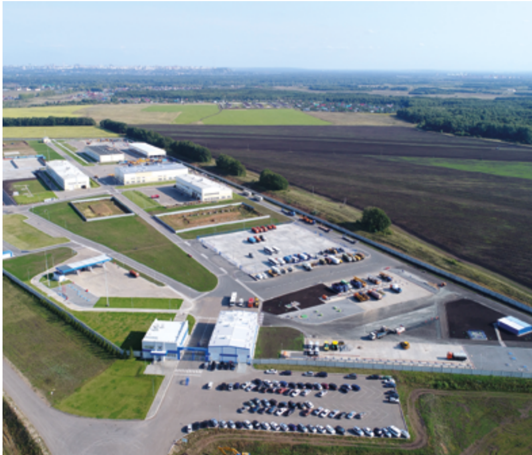
Управление аварийно-восстановительных работ: следуя курсу инновационного развития

Управление аварийно-восстановительных работ – это многофункциональное подразделение, ответственное за проведение ремонтных работ на магистральных газопроводах, компрессорных, газораспределительных станциях Общества и обеспечение надежности оборудования. Это место концентрации инновационных идей, креативных решений и инициативных работников. В феврале филиал отмечает 15-летие со дня образования.