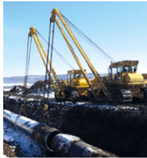
Подключение камеры запуска в Аркауловском ЛПУМГ

На линейной части произведен капитальный ремонт участка газопровода Уренгой – Петровск с 2044 по 2059 км с полной заменой трубы, а также технологических трубо-