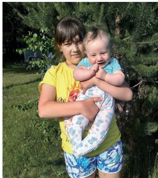
Даше играть в куклы некогда