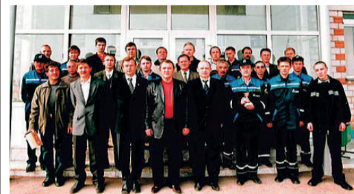
Участники конкурса профмастерства, 2000 г.