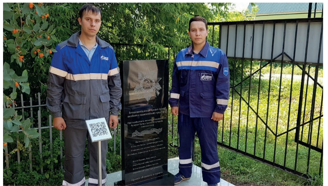
В память о героях