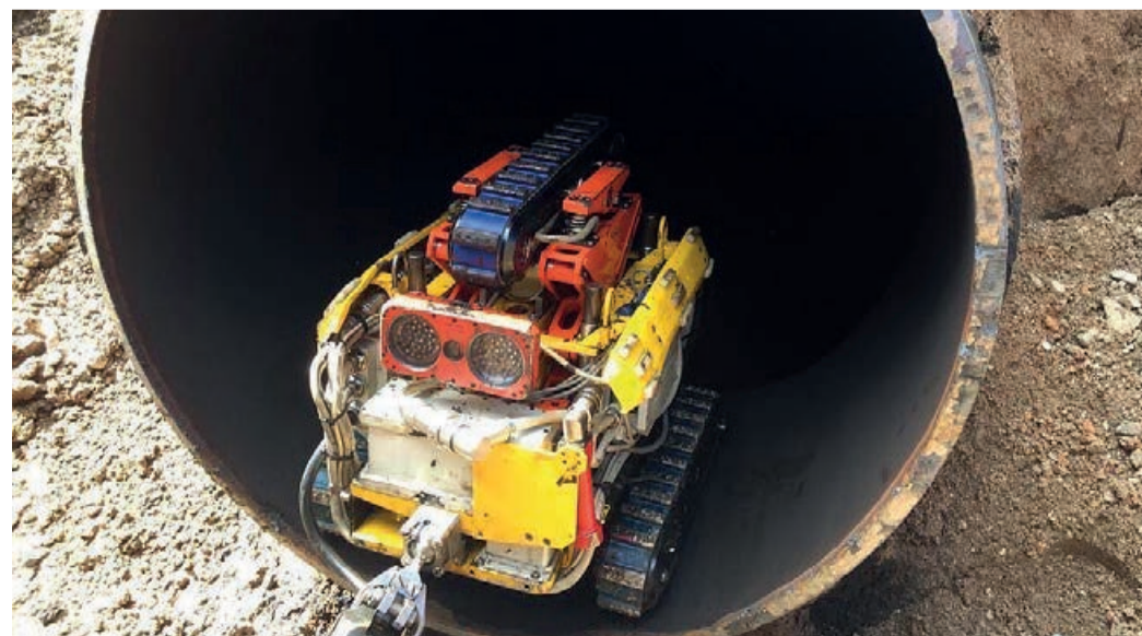
Прохождение робота по трубопроводу

Азалия АХМАТНУРОВА, Фото Шаранского ЛПУМГ