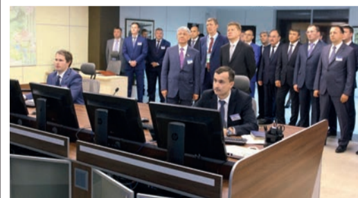
В новом диспетчерском центре, 2015 г.

10 июля 2015 года в столице Республики Башкортостан начал работу новый диспетчерский центр ООО «Газпром трансгаз Уфа». С современным объектом ознакомился председатель Правления компании «Газпром» Алексей Миллер, который прибыл в Уфу в рамках участия в саммитах ШОС и БРИКС. При его создании использовано высоконадежное оборудование, он оснащен промышленной SCADA-системой, позволяющей контролировать процессы в режиме реального времени.