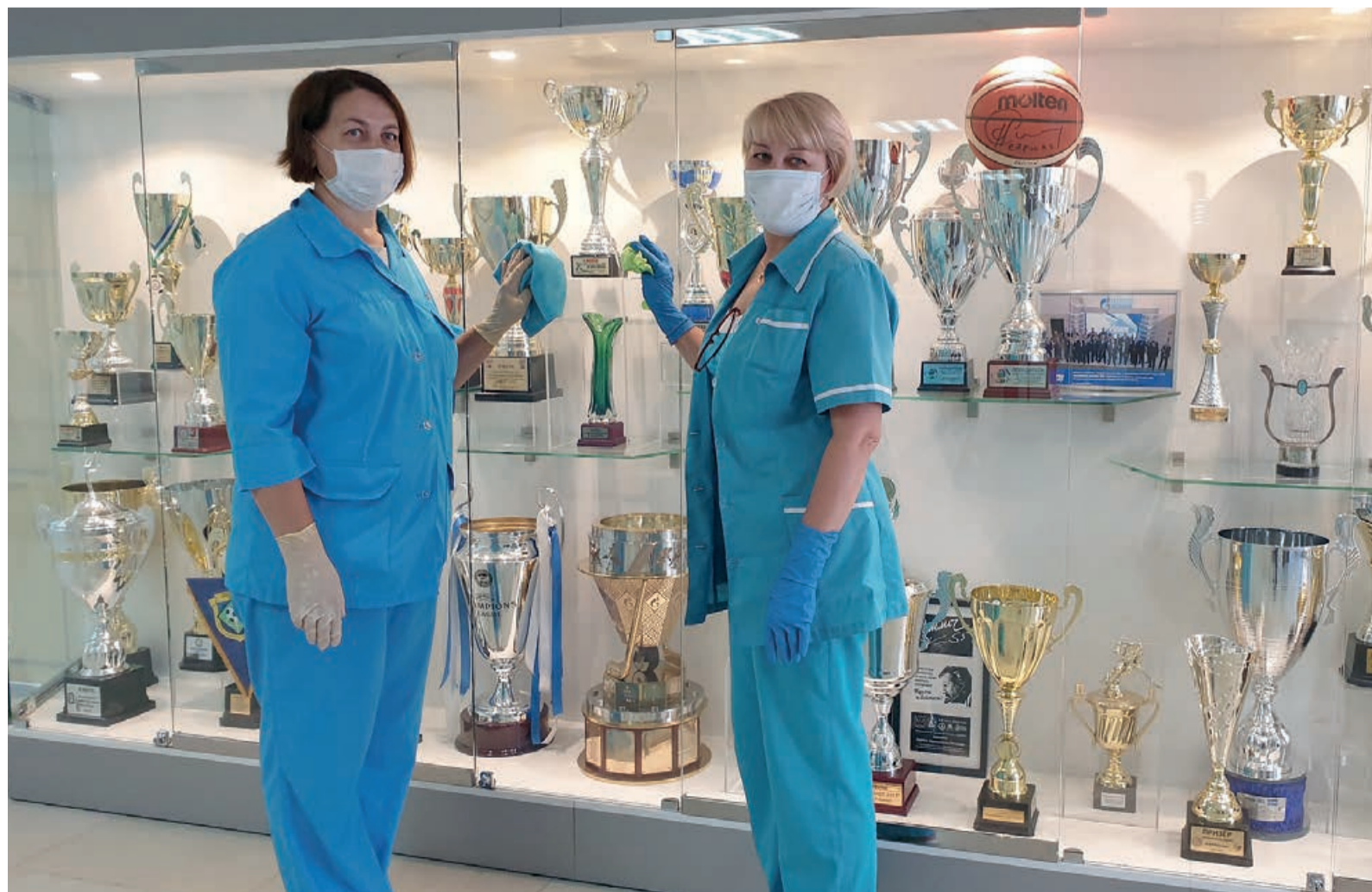
Уборка «на совесть»

Правила уборки в доме во время пандемии: