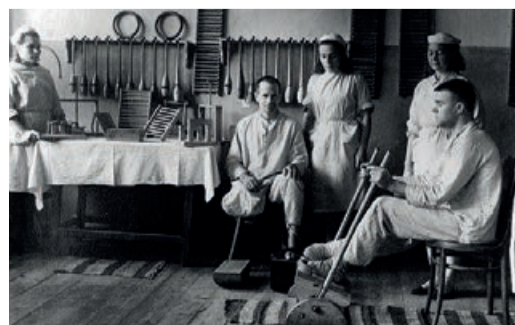
КОД ПАМЯТИ стр. 4