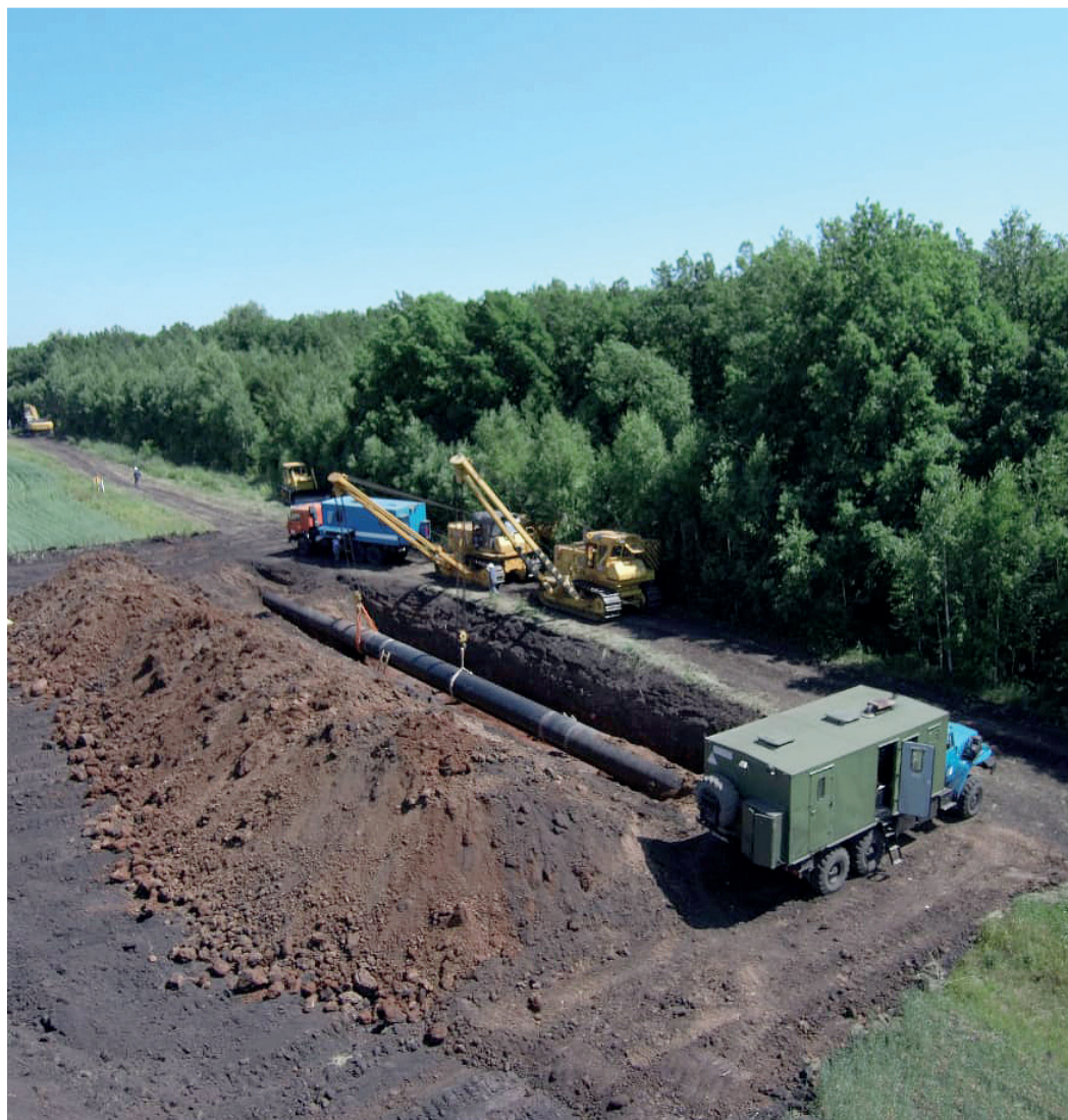
Горячая пора башкирских газотранспортников

Полным ходом ведутся работы по повышению надежности газопровода Поляна–КСПХГ, имеющего стратегическое значение для башкирской «подземки».