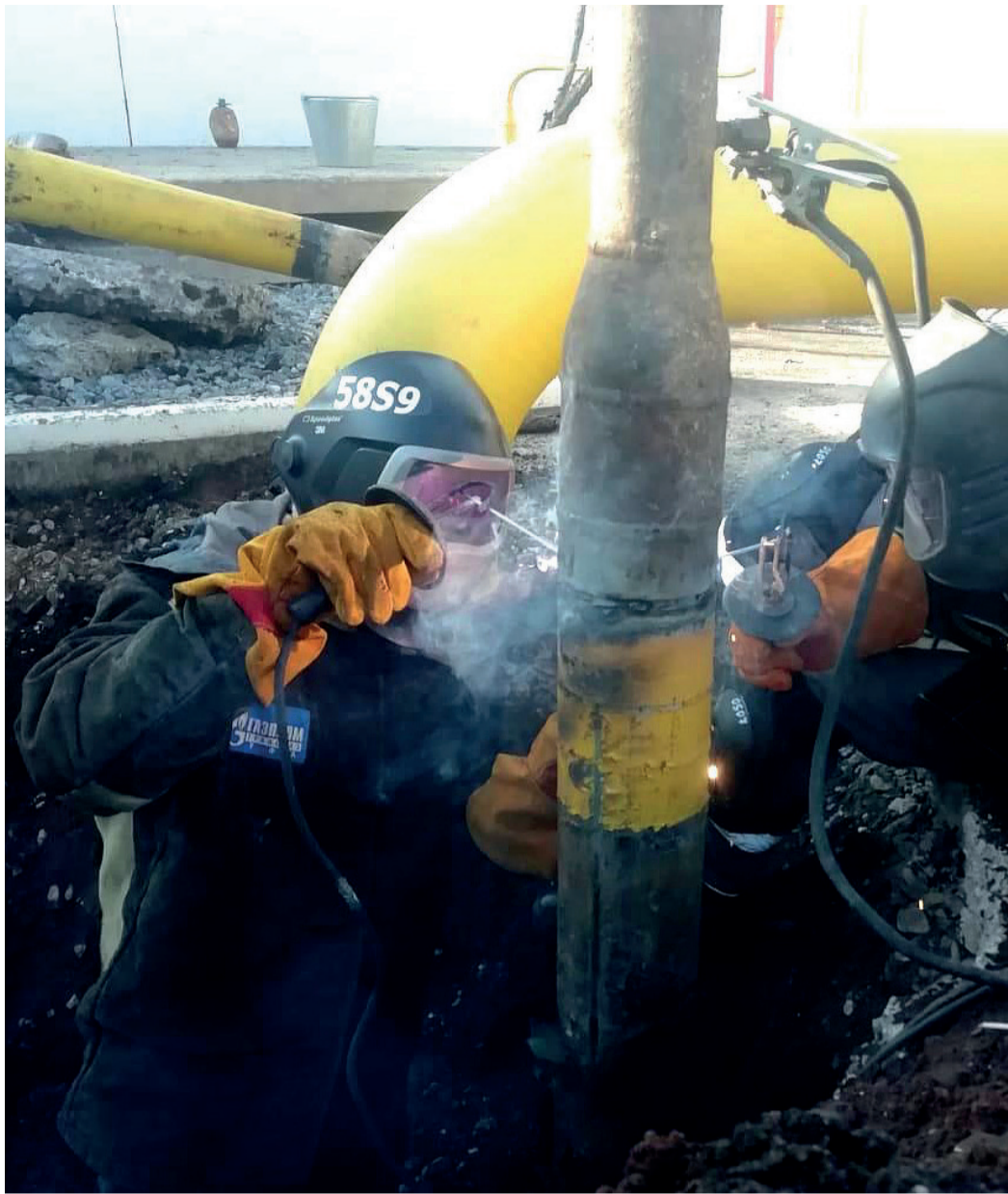
Масштабное обновление ГРС Новомихайловка

Эльвира КАШФИЕВА.