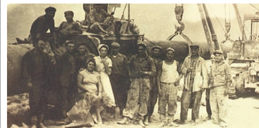
На строительстве газопровода, 1962 г.

В июле 1962 года уфимские студенты ознакомились на ударной комсомольской стройке – возведении газопровода Бухара–Урал. Часть из них занималась строительством компрессорной станции КС-13 в десятках километров от железнодорожной станции Эмба.