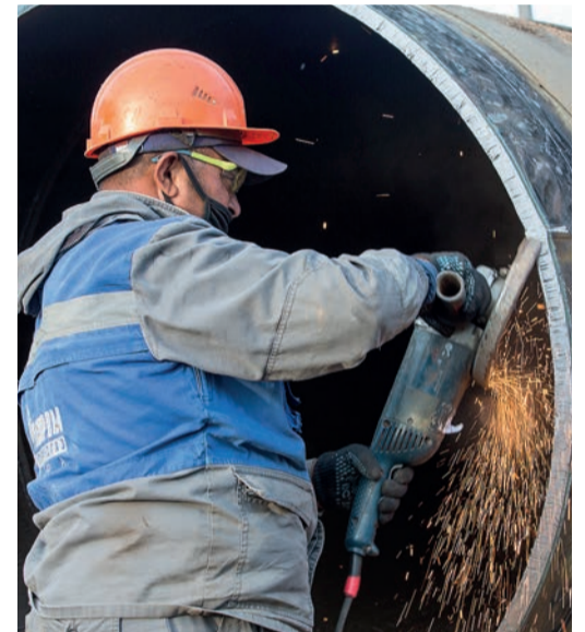
С искрой в душе