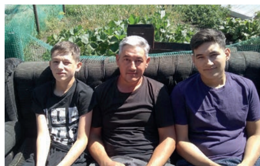
ШЕСТЬ ГРАНЕЙ СЧАСТЬЯ стр. 5