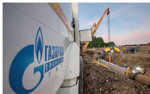
ЗАВЯЗАЛИ В УЗЕЛ стр. 2

Р.Ф. Хабиров, Глава Республики Башкортостан