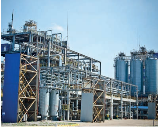
Территория завода «Мономер»

Компания «Газпром нефтехим Салават» завершила капитальный ремонт в четырех цехах завода «Мономер». В его рамках проведены мероприятия по диагностике и ревизии около 1,5 тыс. единиц технологического оборудования и трубопроводов, реализованы мероприятия, направленные на увеличение производительности и эффективности, заменено 176 единиц арматуры низкого и высокого давления.