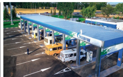
ГАЗ И НАВСЕГДА стр. 8