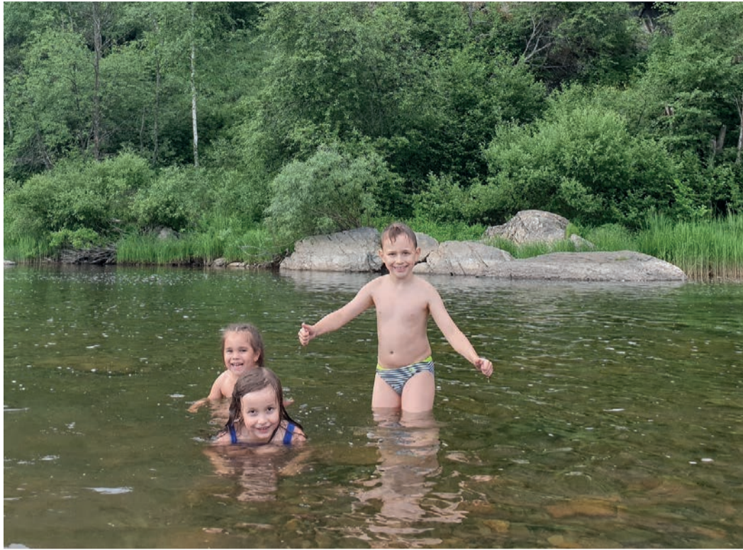
Водоёмы – зона повышенной опасности

Июль-август – пик купального и пожароопасного сезона. Башкортостан бьет печальные рекорды по случаям гибели людей на воде и возгораний в лесных массивах. «ГАЗета» напоминает об основных правилах, которые нужно знать, отдыхая на природе.