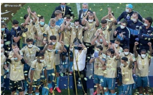
«Зенит» – чемпион!

На «Газпром Арене» «Зениту» вручили Кубок Российской Премьер-лиги. Команда стала шестикратным чемпионом России. Это самое быстрое чемпионство в истории РПЛ – за четыре тура до финиша.