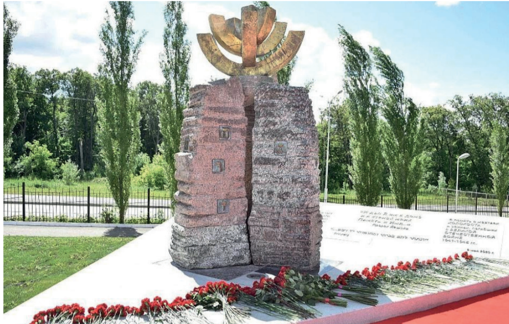
Памятник жертвам Холокоста в Уфе

Памятник представляет собой монументальную композицию высотой 3,5 м, составленную из трех каменных колонн, увенчанную разбитой менорой (семирожковым подсвечником), которая стилизована под вечный огонь. Автором работы стал петербургский художник Александр Позин.