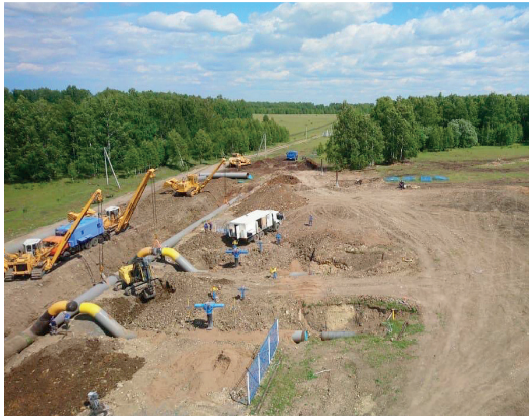
Ремонт технологических трубопроводов узла подключения КС-3

В Аркауловском ЛПУМГ завершен капитальный ремонт технологических трубопроводов узла подключения КС-3 Аркаулово. Работы были разделены на три этапа. Это связано с режимом транспорта газа и установленными сроками проведения комплексов ППР.