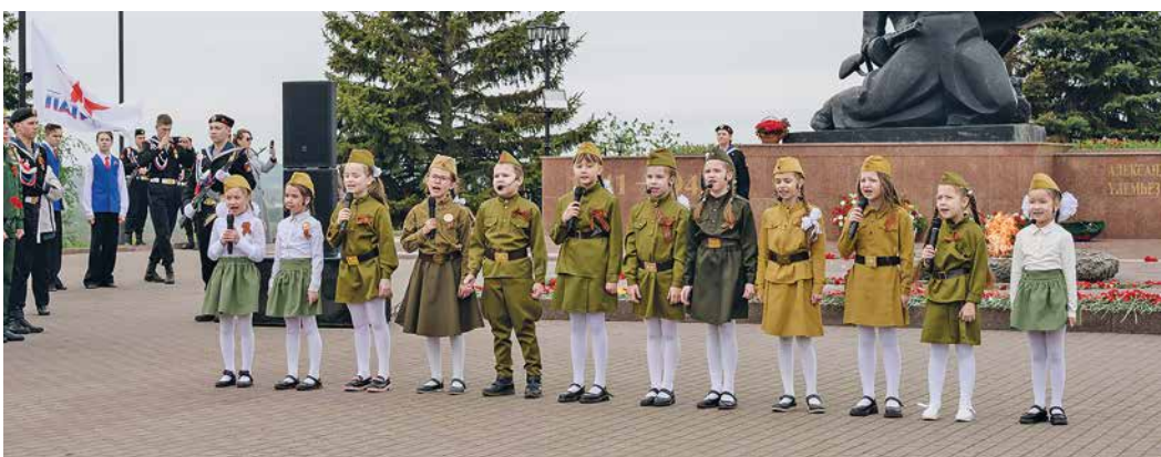
Выступление маленьких артистов