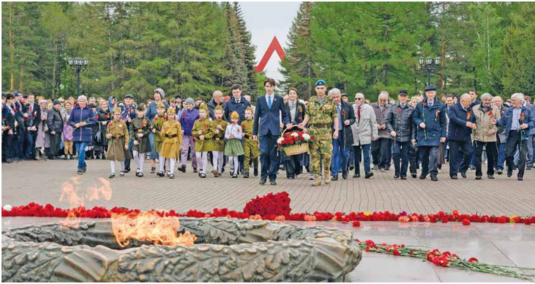
Возложение цветов к Вечному огню

В ООО «Газпром трансгаз Уфа» состоялись праздничные мероприятия в честь Дня Победы.