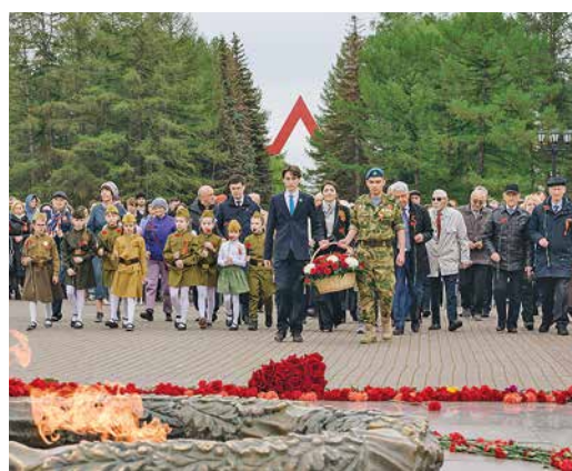
ПОМНИМ, СЛАВИМ, ГОРДИМСЯ стр. 2