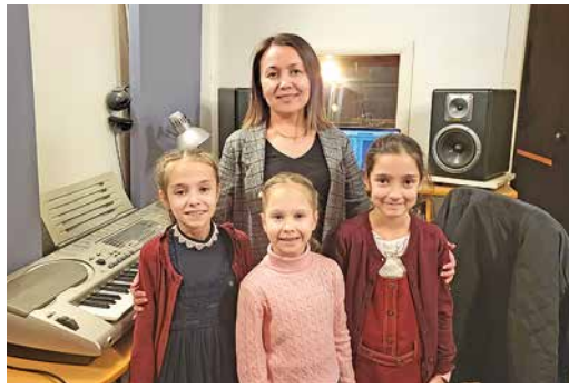
Пение нас связало

– Мы очень рады, что у наших детей есть возможность не только встречать-