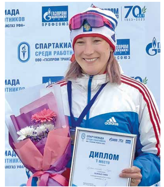
Традиционно первое место

– Мы рады, что смогли привить детям вкус к активности, чтобы движение стало неотъемлемой частью их жизни. Не каждый станет чемпионом, но каждый обязательно должен вырасти крепким и здоровым. Об этом необходимо помнить всем родителям. Совместные увлечения сближа-