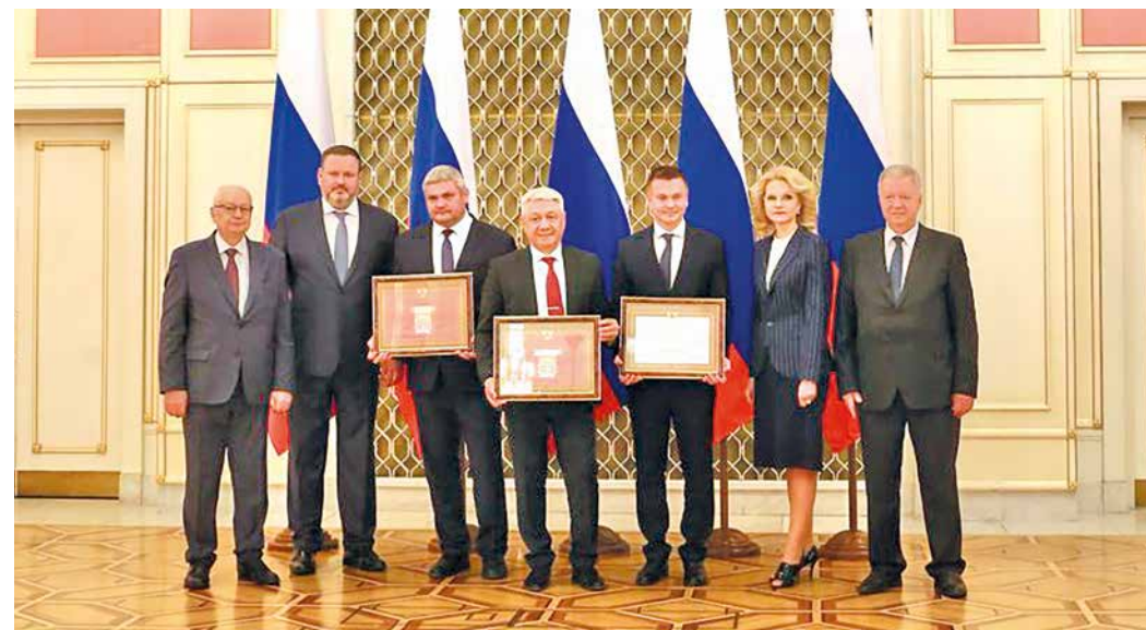
Получили заслуженную награду

– Очень важно не только сохранить, но и приумножить достигнутые результаты. Это прежде всего целенаправленная работа с кадрами по повышению профессионального уровня работников, привлечению, адаптации и закреплению молодежи, мотивации к труду за счет прозрачных систем оплаты труда, привлекательного социального пакета, обеспечению безопасных и здоровых условий труда, предупреждению производственного травматизма и профессиональных заболеваний, – подчеркнула заместитель Председателя Правительства РФ Татьяна Голикова.