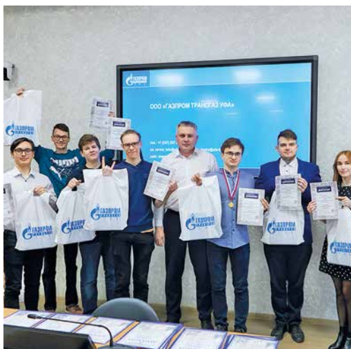
Довольные призы и победители олимпиады