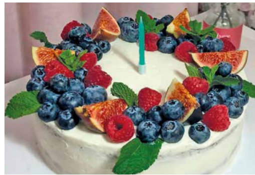
Украшение – особый вид искусства

– Стараюсь не только вкусно приготовить, но и красиво оформить и подать. Пеку торты, рулеты, капкейки, чизкейки, пирожные и множество разных блюд. Любовь ко всему этому, еще в юности, в меня заложили моя бабушка и мама. Бабушка хорошо умела вязать, шить