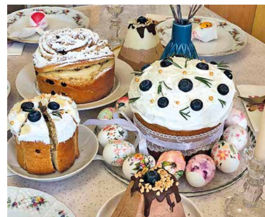
КОГДА РАБОТА И ХОББИ В РАДОСТЬ стр. 8