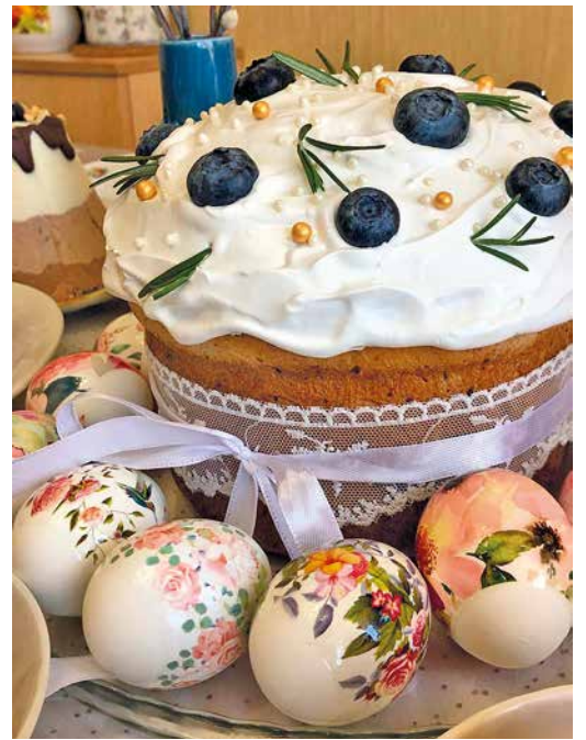
Красота для любого праздника