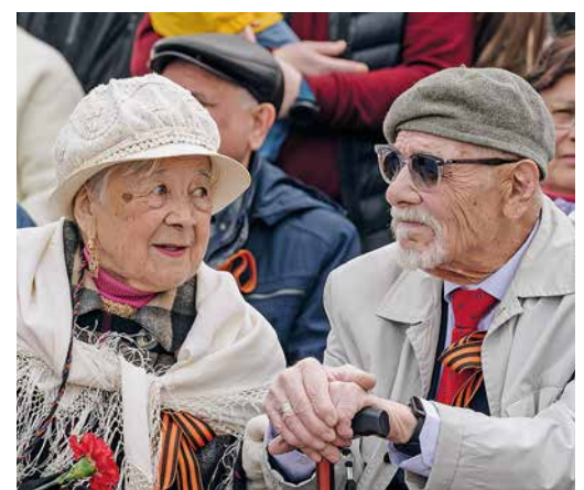
Ветераны предприятия на празднике