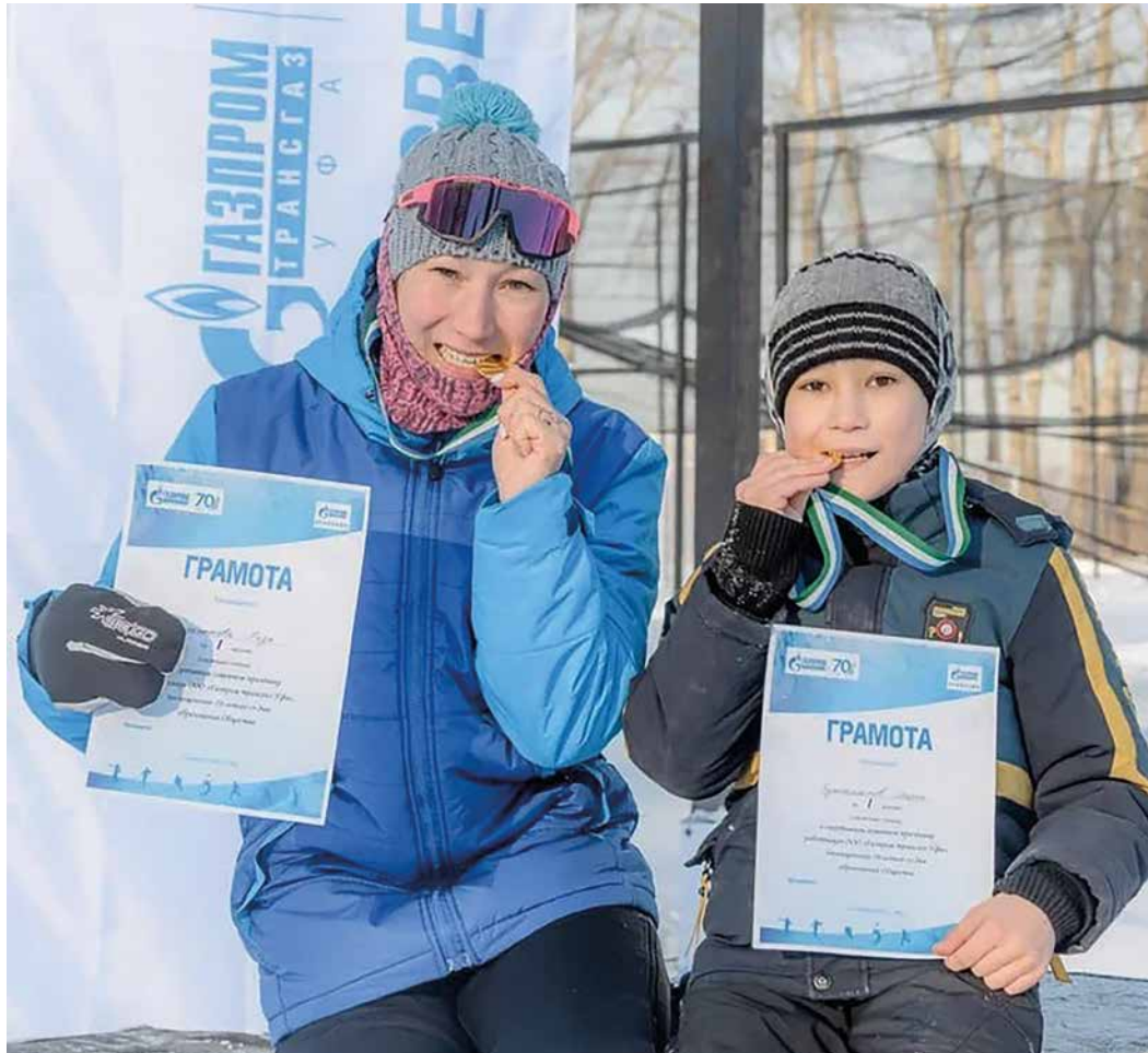
Призовые места – наши

2024 год объявлен годом семьи в России. Семья помогает, дает силы жить, мотивирует, вдохновляет. Безусловно, спортивная семья, в которой физическая активность является образом жизни, – лучший мотиватор интереса детей к спорту, а значит, залог здоровья в будущем.