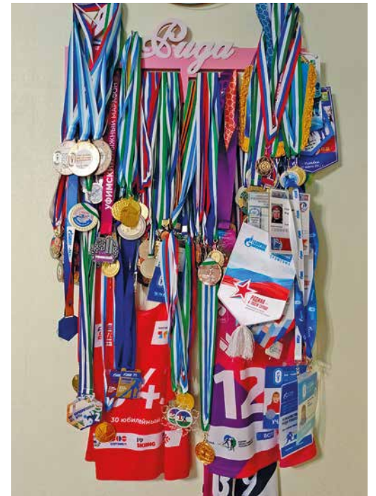
Награды для лучшей