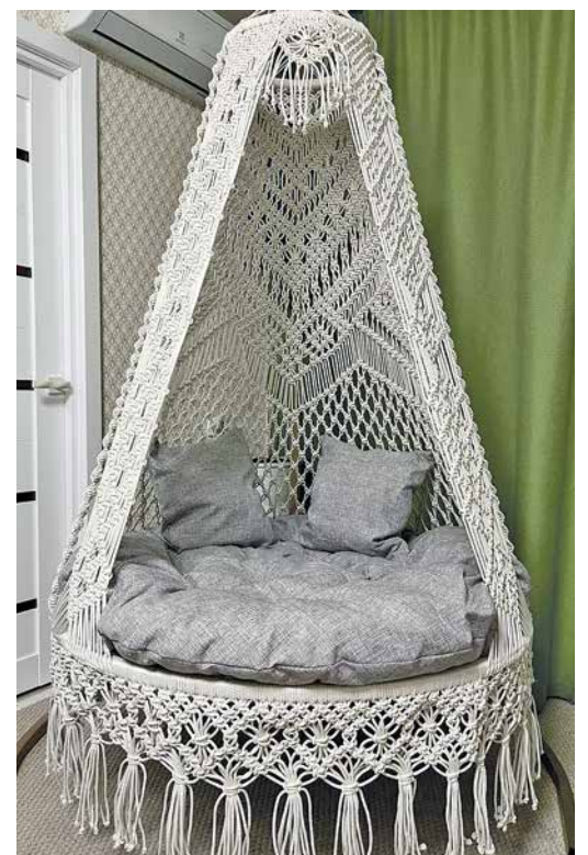
Одно дело на двоих