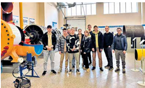
На экскурсии по производству