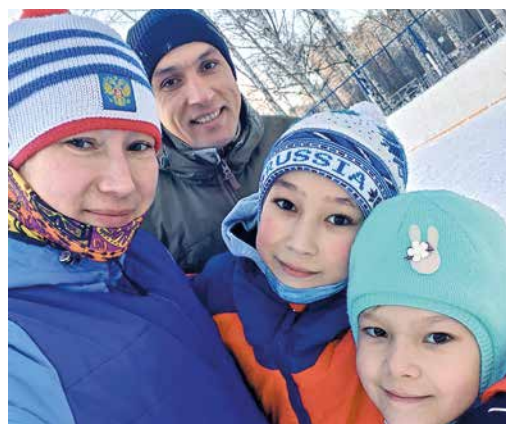
БЫТЬ ЗДОРОВЫМ - МОДНО стр. 6