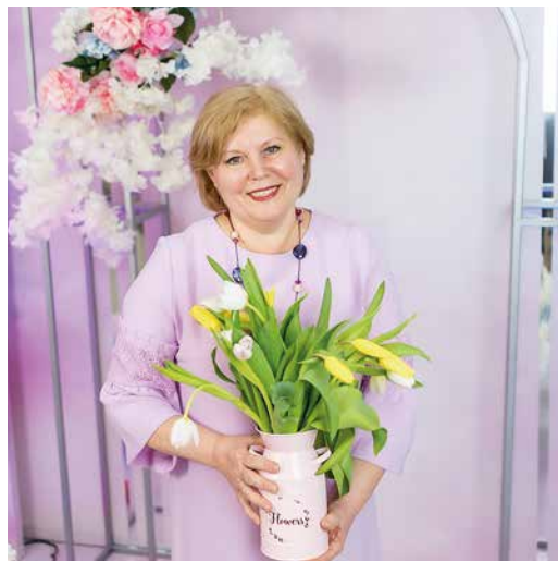
Создатель кулинарных изысков

В продолжение акции «Рецепты счастливой семьи» работница предприятия делится секретами своего кулинарного мастерства.