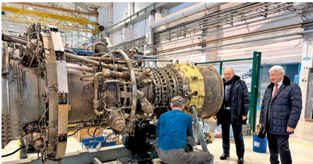
На площадке Уральского завода гражданской авиации