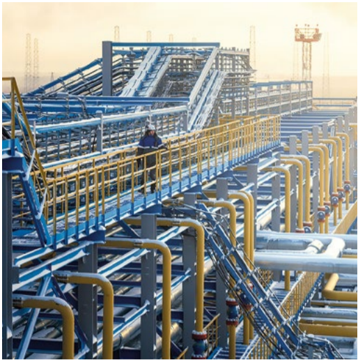
Потребление нефти, газа и угля достигло исторических максимумов

Совет директоров ПАО «Газпром» принял к сведению информацию о влиянии событий 2024 года на долгосрочный прогноз развития мирового энергетического рынка.