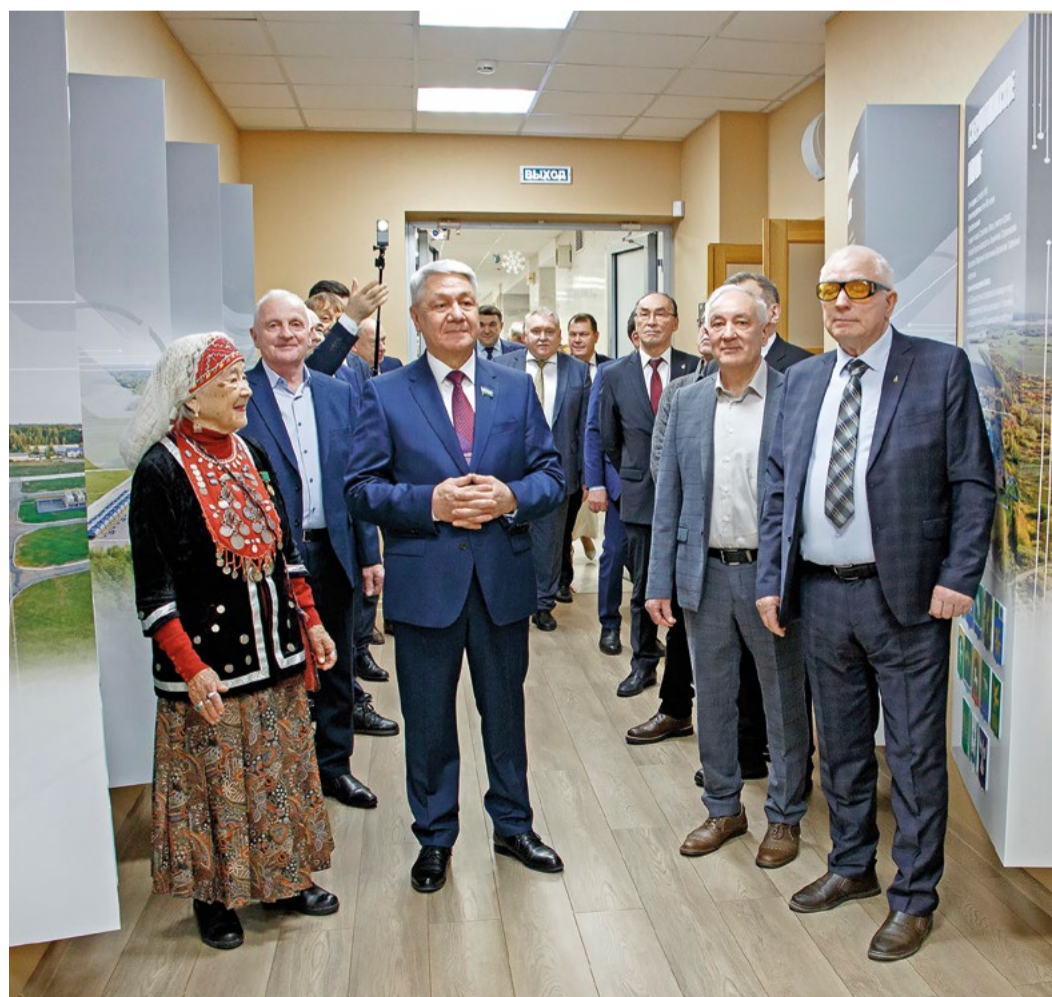
Зал Славы станет еще одним местом притяжения и встречи поколений