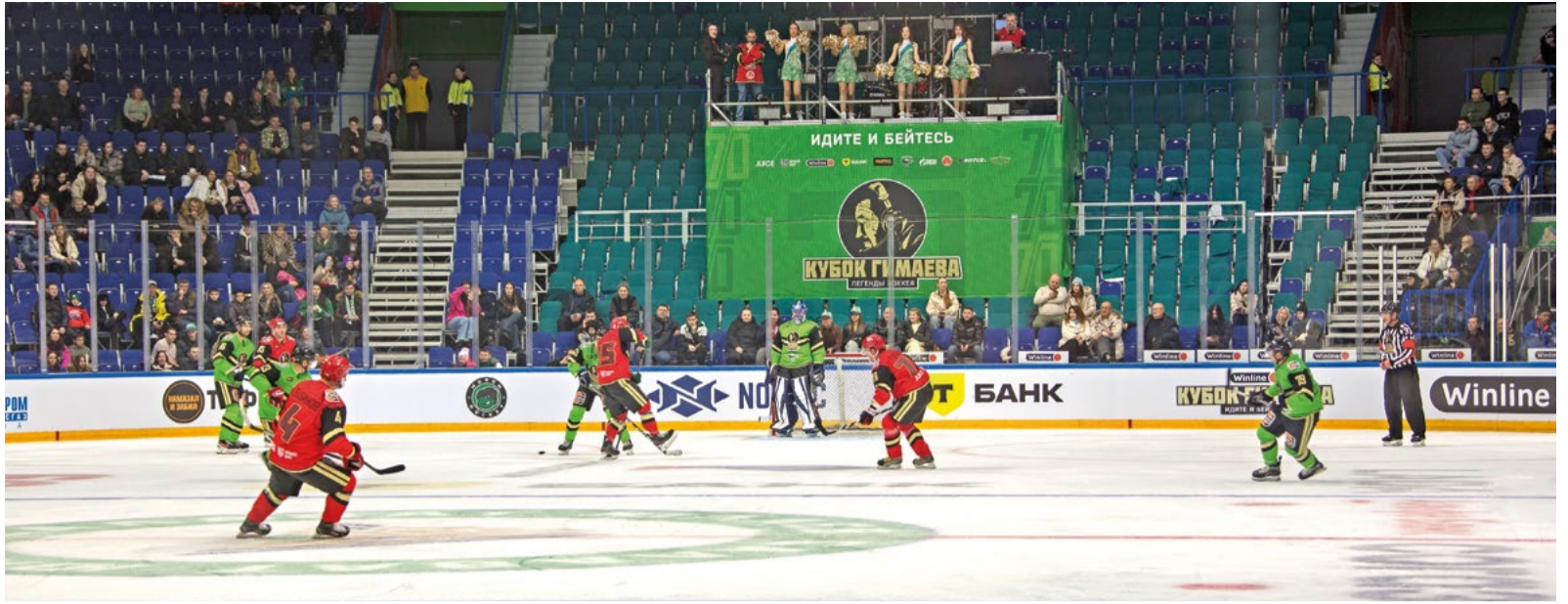
Схватка «зеленых» и «красных»

Во встрече приняли участие прославленные российские спортсмены – Вячеслав Фетисов, Илья Ковальчук, Сергей Мозякин, Данис Зарипов, Максим Афиногенов и другие.