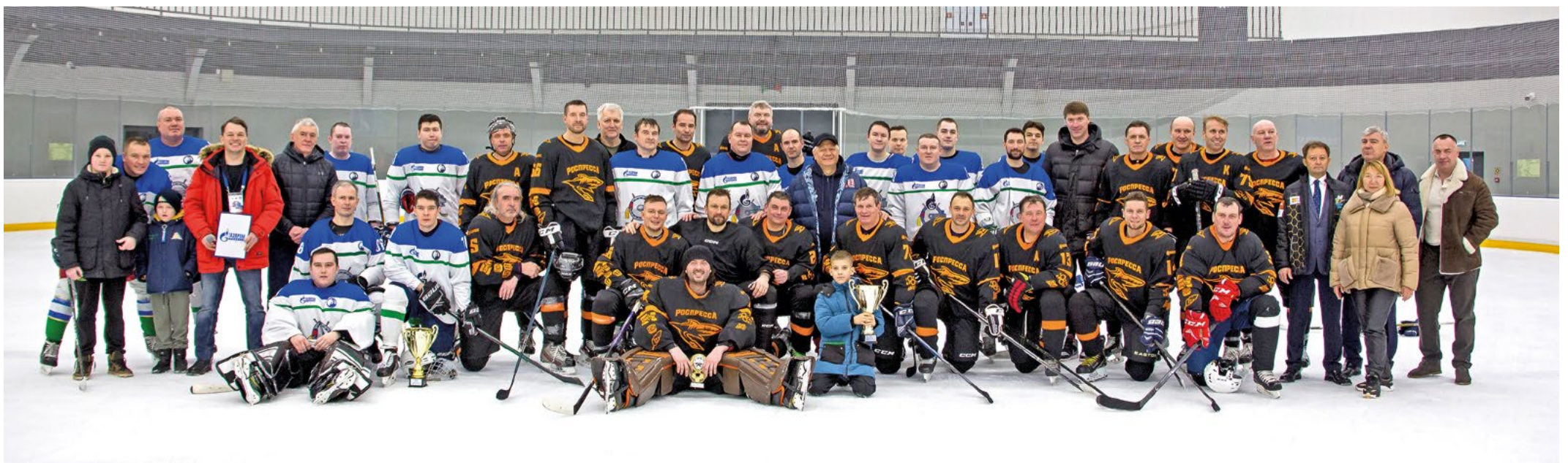
Участники 13-й встречи