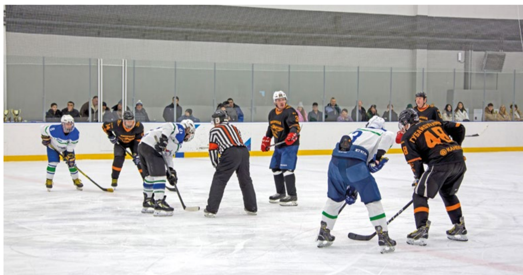
Чей гол будет решающим?