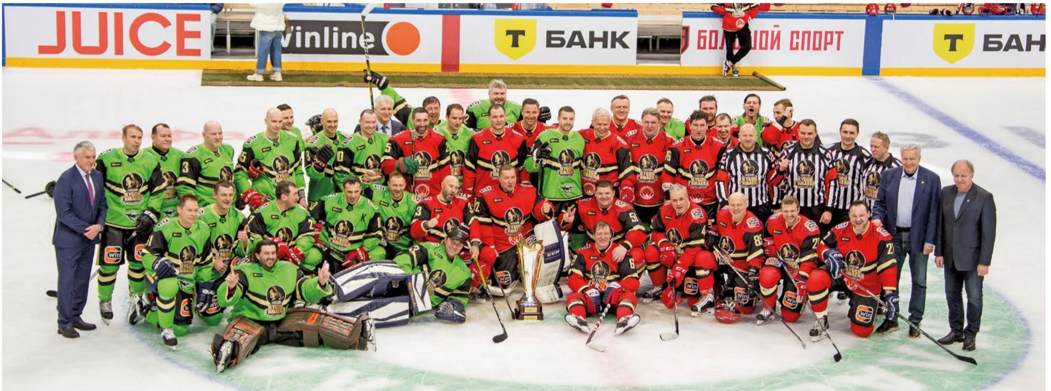
Памяти Сергея Гимаева

Эльвира КАШФИЕВА, Алина ИСАВКИНА.