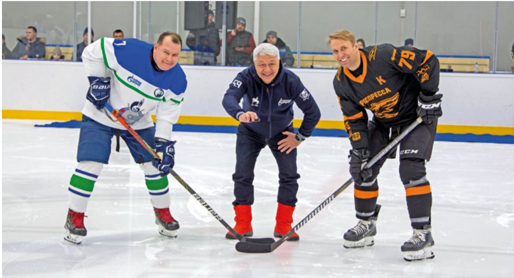
«Пусть победит сильнейший!»

11 января в Центре спортивной подготовки имени Ульфата Мустафина состоялся традиционный праздник спорта с участием известных хоккеистов, журналистов, комментаторов, экспертов и ведущих федеральных каналов – команды «Российская пресса».