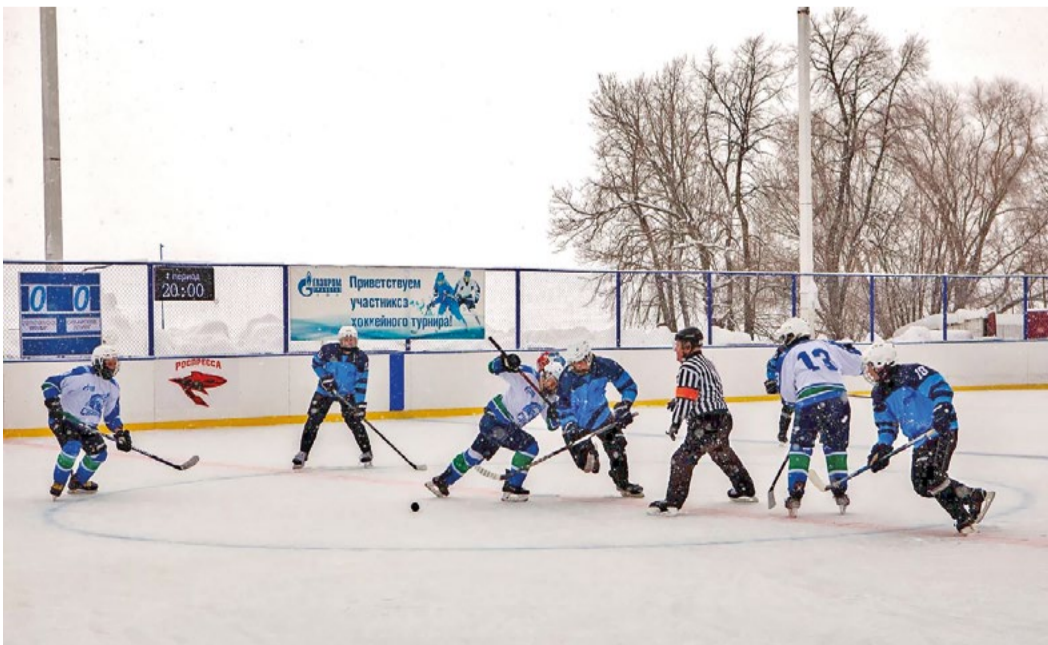
В борьбе за шайбу

В Обществе стартовал XV турнир Корпоративной хоккейной лиги. За год команды набрались сил, энергии, выучили новые тактики.