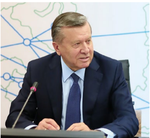
Виктор Зубков: «Вопрос развития рынка газомоторного топлива надо решать комплексно»

В интервью для специального репортажа на телеканале «Россия 24» Председатель Совета директоров ПАО «Газпром», специальный представитель Президента Российской Федерации по взаимодействию с Форумом стран – экспортеров газа Виктор Зубков подвел итоги уходящего года и обозначил перспективы развития рынка газомоторного топлива России.